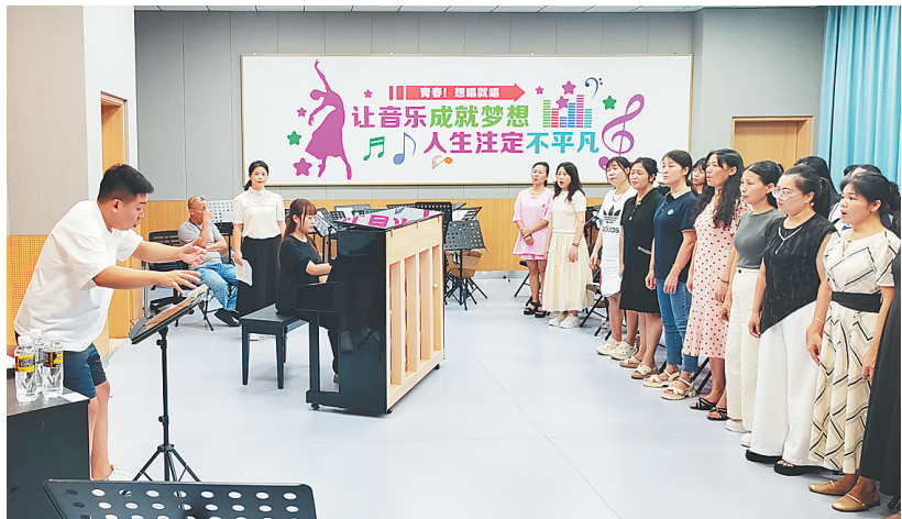
儋州爱乐追光合唱团成员参加排练。

唱团名字，寄托着对团员的期许。我们追逐音乐这道艺术之光、教书育人这道责任之光，更希望成为照亮儋州学生成长之路的希望之光。”儋州市教育局党委书记、局长杨永飞表示，下一步，将争取把合唱艺术打造成儋州亮丽的文化新名片，让更多人感受合唱艺术的魅力，让校园充满欢乐，让“诗乡歌海”再添新韵。