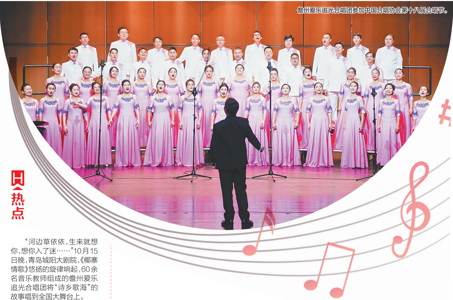
儋州爱乐追光合唱团参加中国合唱协会第十八届合唱节。