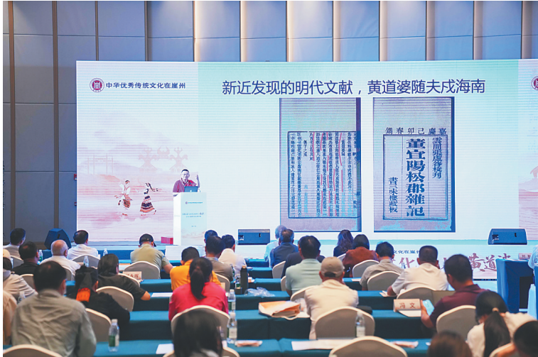
10月21日，以“崖州文化与历史文化名人黄道婆”为主题的研讨会在三亚举办。