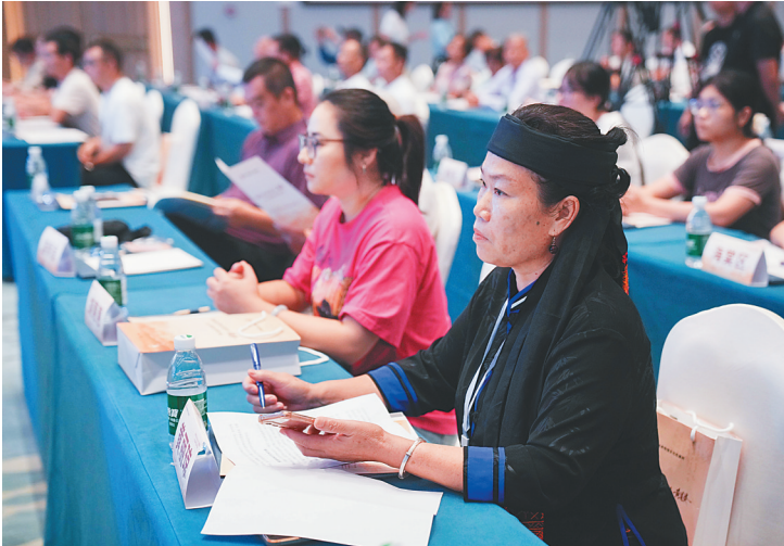
图为与会嘉宾在现场认真聆听。

据海南省戏剧家协会副主席、《黄道婆》编剧陈焕介绍，该剧创作三年来已演出近三十场，并逐步走出海南，赴上海、浙江等地展演。“黄道婆是教科书中的历史人物，我们通过舞台让她‘活’起来，借助媒体传播与跨省展演，让更多人了解‘黄道婆精神’，这是非常有意义的。”他还透露，“本月底我们将赴南宁参加第十二届中国—东盟（南宁）戏剧周，同时也在积极谋划前往更多国家和地区演出，让黄道婆的故事传播得更远。”