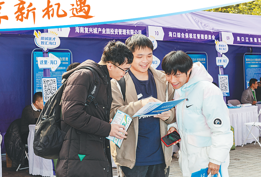
10月25日，2025年海南省“封关拓新局·四城同办”校招活动（北京站）在清华大学启幕。