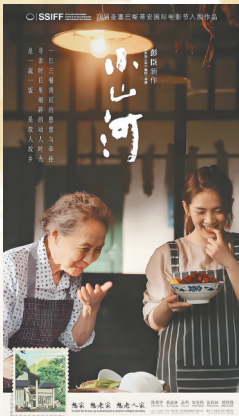
《小山河》美食版海报。《小山河》人物版海报。《小山河》海报语言生动。