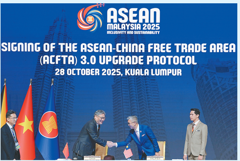
10月28日,中国-东盟自贸区3.0版升级议定书在马来西亚吉隆坡签署。

当地时间10月28日,中国与东盟在马来西亚首都吉隆坡签署自贸区3.0版升级议定书,标志着中国与东盟经贸合作水平再次升级。分析人士认为,在全球经济面临诸多不确定性之际,3.0版升级议定书的签署是中国与东盟共同推动高质量开放合作的重要举措,展现了区域国家携手应对全球经济挑战的决心,为区域经济发展注入新动能和信心。