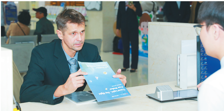
↑ “海南钱包”首发仪式现场。 ↓ 外籍人士体验“海南钱包”。