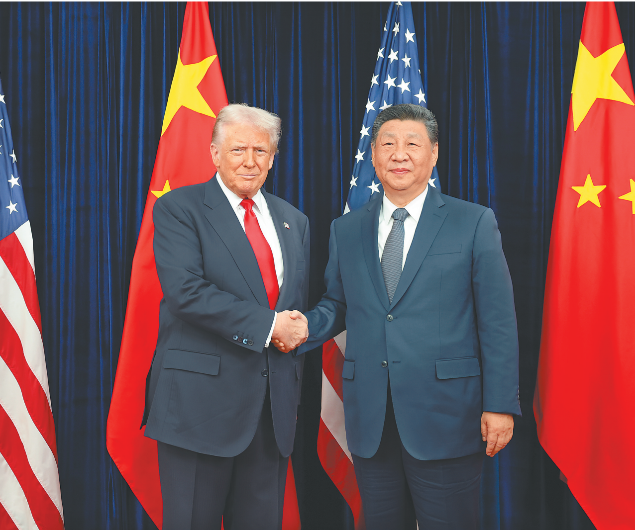
当地时间10月30日，国家主席习近平在釜山同美国总统特朗普举行会晤。

新华社韩国釜山10月30日电(记者李忠发 郝薇薇)当地时间10月30日，国家主席习近平在釜山同美国总统特朗普举行会晤。