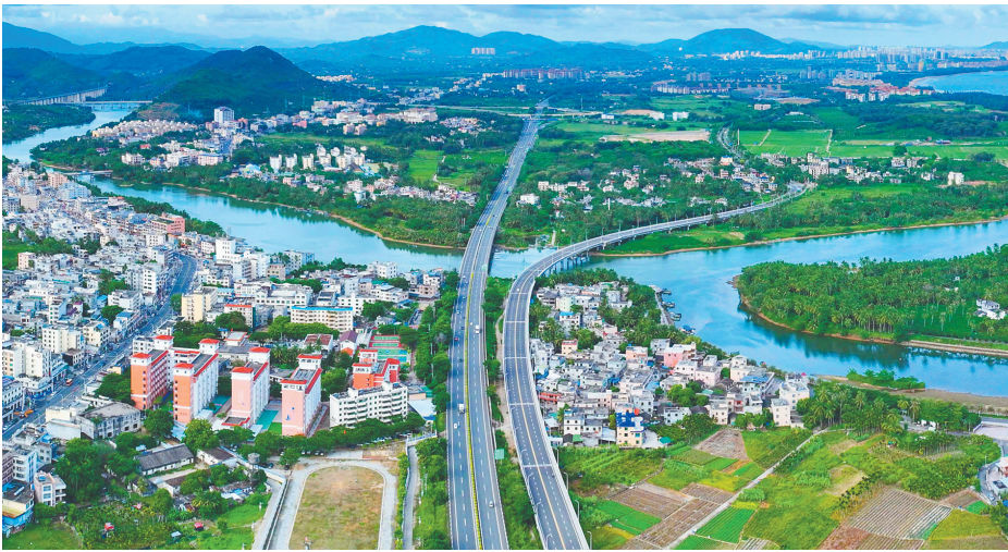
俯瞰位于三亚市海棠区藤桥河畔的营头村。