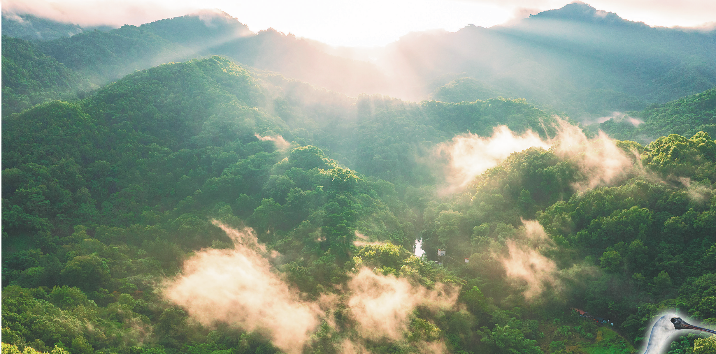
晨光中的海南热带雨林国家公园五指山片区，云雾缭绕。