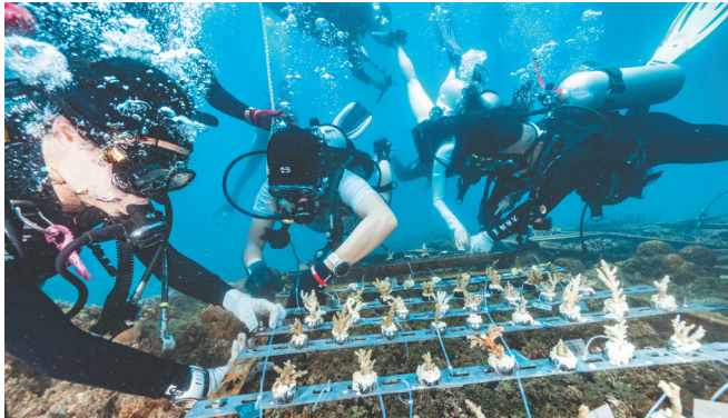
志愿者潜入三亚大东海海底种植珊瑚苗，为修复海底生态系统播撒“蓝色希望”。