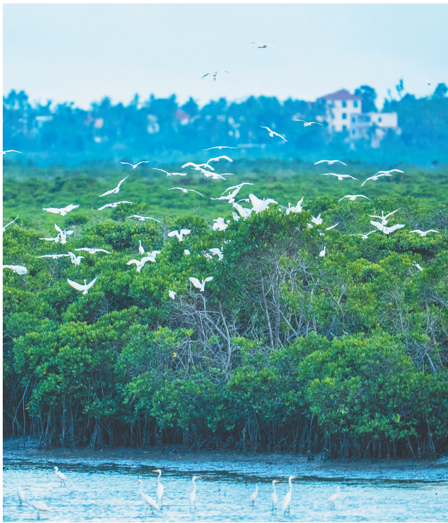
栖息在海南东寨港国家级自然保护区的鹭鸟。海南日报全媒体记者 李天平 摄