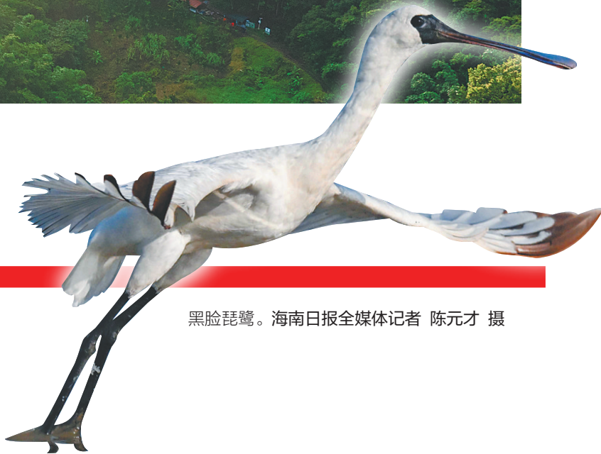
黑脸琵鹭。