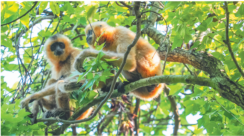
栖息在海南热带雨林国家公园霸王岭片区的海南长臂猿。