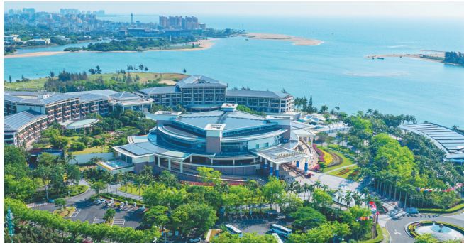
博鳌零碳示范区。