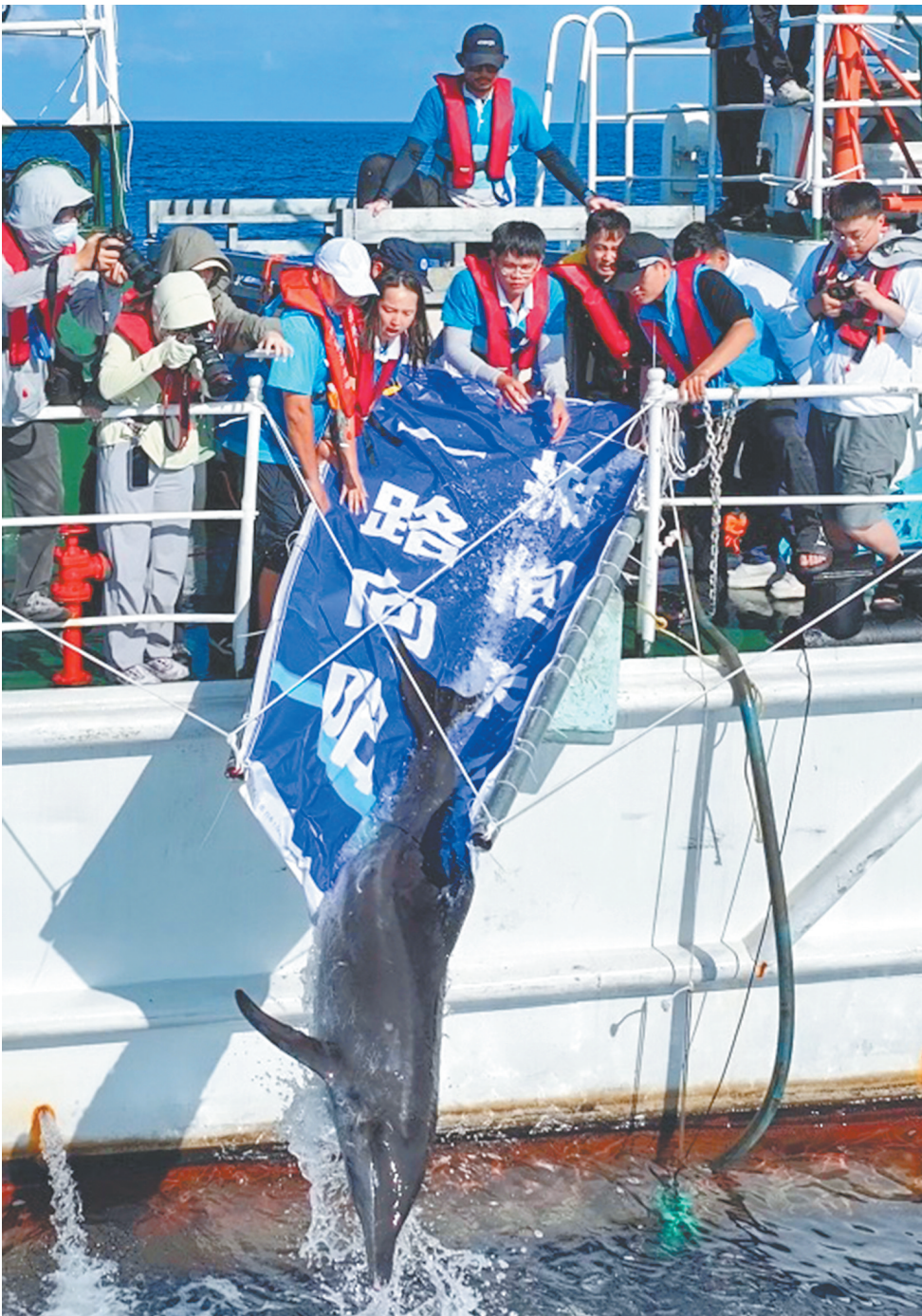
糙齿海豚“阳阳”在三亚亚龙湾青梅港搁浅，各方力量及时响应，悉心救治，历时一个多月将其成功放回大海。