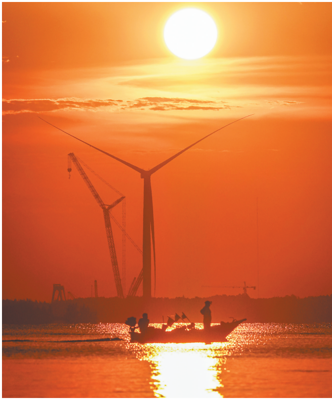
海南加快能源基础设施提质升级，推进清洁能源岛建设。图为明阳（临高）大型海上风电机组检测试验基地。

今天，让我们一同跟随镜头，感受海南自贸港那抹动人的生态底色，聆听一曲绿色发展的优美乐章。