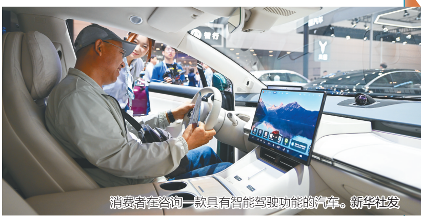
消费者在咨询一款具有智能驾驶功能的汽车。

新华社北京11月5日电 国务院关税税则委员会11月5日公布公告称，为落实中美经贸磋商达成的成果共识，根据《中华人民共和国关税法》《中华人民共和国海关法》《中华人民共和国对外贸易法》等法律法规和国际法基本原则，经国务院批准，自2025年11月10日13时01分起，停止实施《国务院关税税则委员会关于对原产于美国的部分进口商品加征关税的公告》（税委会公告2025年第2号）规定的加征关税措施。