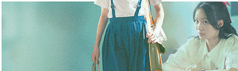
《女孩》中的每个角色都很出彩。