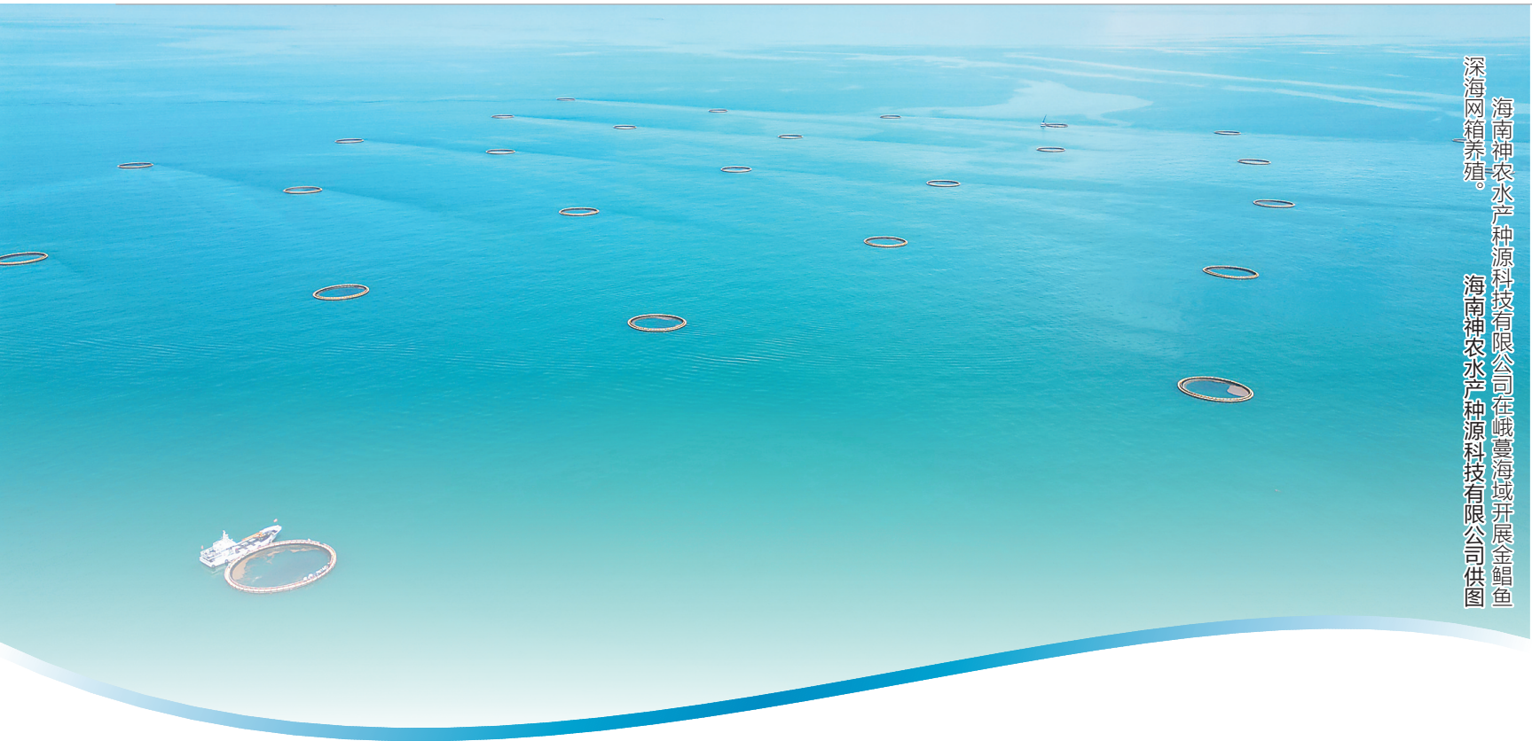
海南神农水产种源科技有限公司在峨蔓海域开展金鲳鱼深海网箱养殖。