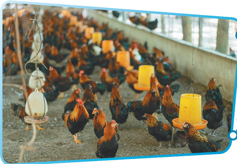
在生态养殖基地里的儋州鸡。资料图

截至目前，通过简化登记流程、优化服务体验，儋州洋浦已构建起“事前高效审批、事中精准监管、事后便利服务”的全周期服务体系，不仅让企业办事成本显著降低，更以市场化、法治化、国际化的营商环境，为海南自贸港“样板间”建设注入强劲动力。