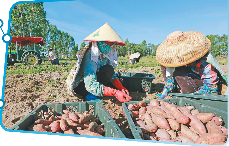
村民在儋州南岸村的海头地瓜种植基地里挖地瓜。资料图