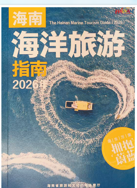
《海南海洋旅游指南(2026年)》。