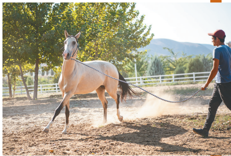
土库曼斯坦的汗血马。