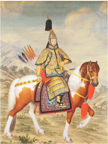
清郎世宁绘《乾隆皇帝大阅图》轴。本版图片除署名外均为资料图