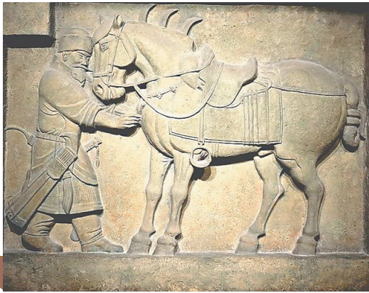
『昭陵六骏』石刻之飒露紫。

近日，考古科研人员从陕西霸陵（汉文帝刘恒陵墓）出土的马骨中成功提取了DNA。通过对基因组的测序分析，科研人员得出初步结论：墓中的两匹古马均为雄性，其中一匹与古代中亚乃至现代阿拉伯马有着密切的亲缘关系，另一匹则很可能是东亚的本土马匹。那么，这一发现与历史上记载的“汗血宝马”是否存在关联呢？