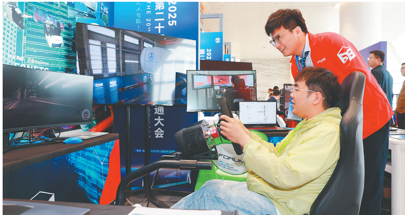
参会嘉宾体验汽车模拟驾驶。

人海和谐，不负蔚蓝。从深海科技突破到产业集聚发展，从生态环境保护到国际合作拓展，海南海洋经济的高质量发展之路越走越宽广。 （本报海口11月19日讯）