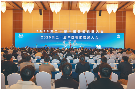
2025第二届中国智能交通大会开幕式现场。