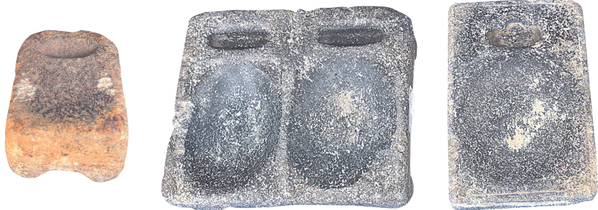
海南民俗博物馆收藏了几十方火山石砚。左为一方专为幼儿定制的微型石砚，长8.7厘米、宽6.5厘米、高4.5厘米。

相对于我国四大名砚以及形形色色的材质高贵、刻制精湛的砚台，火山石砚或许泰陪末座，但它的粗朴、浑厚、简朴、廉价、结实及发墨效果却为琼地千千万万民间秀才、农家学子所钟爱，海南民俗博物馆几十方馆藏古砚前该走出过多少中华优秀传统文化的传承者。