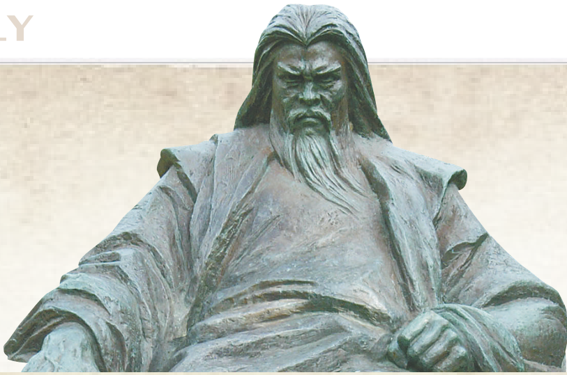
三亚天涯海角景区里的赵鼎塑像。