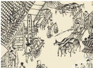
《清明上河图》中的沉香店铺。