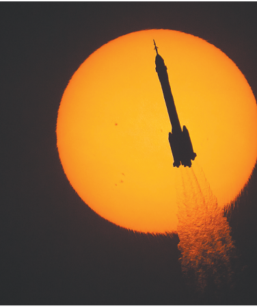
↑ 这是11月25日使用日珥镜拍摄的火箭凌日瞬间。 ↓ 这是11月25日在北京航天飞行控制中心拍摄的神舟二十二号飞船与空间站组合体交会对接过程的模拟画面。

一、滚动备份”策略的科学性可靠性，实战考核了工程全线快速反应、应急处置的能力，生动践行了“特别能吃苦、特别能战斗、特别能攻关、特别能奉献”的载人航天精神。