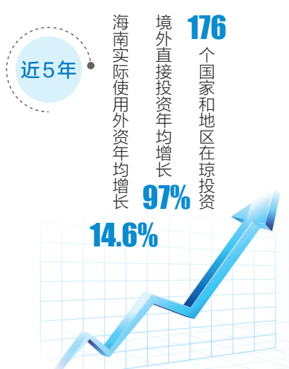
本版AI图：张昕陈海冰