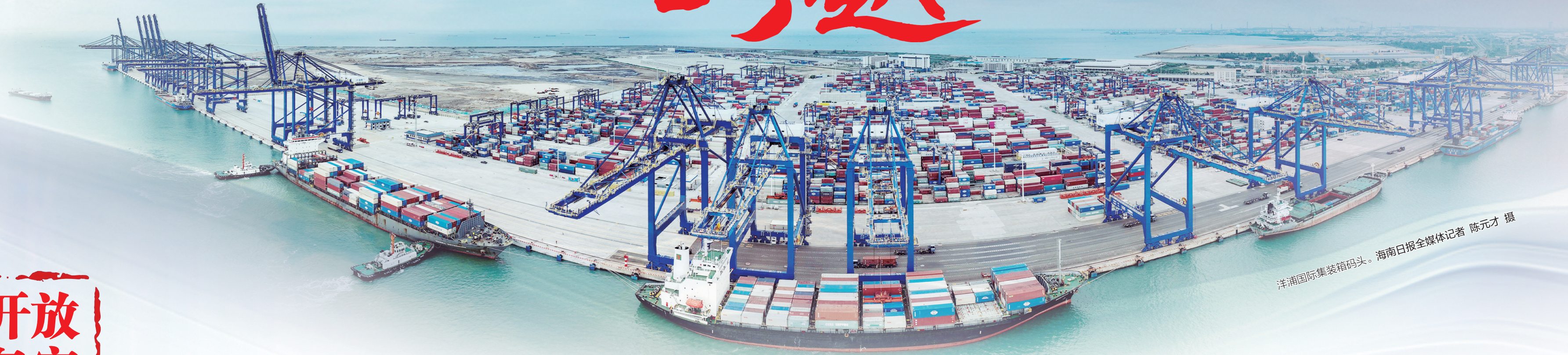
洋浦国际集装箱码头。