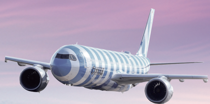
2025年7月，海南国神航空运营的“法兰克福—曼谷—三亚”第五航权定期客航航线开通。（资料图）