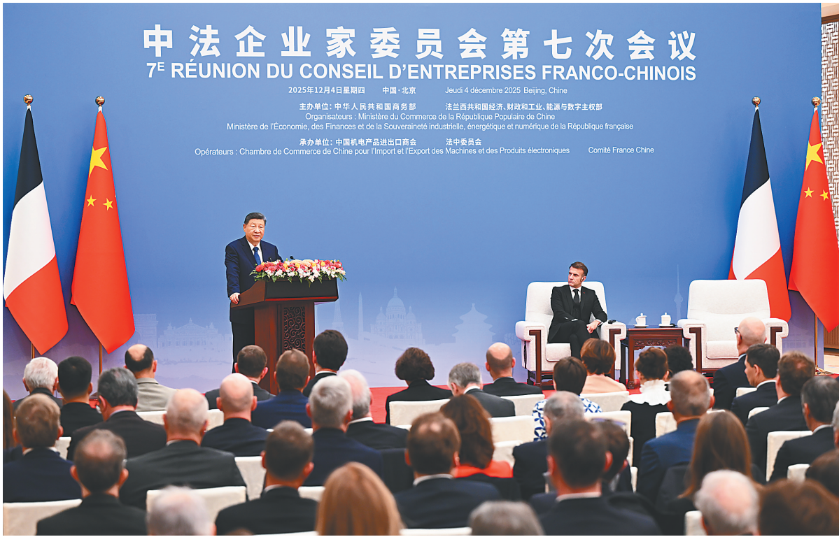
十二月四日中午，国家主席习近平在北京同法国总统马克龙共同出席中法企业家委员会第七次会议闭幕式并致辞。

新华社北京12月4日电（记者董雪 冯歆然）12月4日中午，国家主席习近平在北京同法国总统马克龙共同出席中法企业家委员会第七次会议闭幕式并致辞。 习近平指出，今年是中法关系“新甲子”的开局之年。两国经贸合作领域不断拓展、韧性不断增强。前10个月，双边贸易额达到687.5亿美元，双向投资额累计超过270亿美元。双方要秉持建交初心，抓住机遇、深化合作，推动两国关系行稳致远，共同谱写中法合作更加美好的篇章，以中法关系的稳定性应对当今世界的不确定性。 一是不断拓展双边经贸合作新领域。中方视法方为重要的、不可或缺