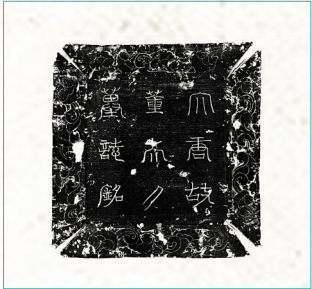
董韶容墓志志盖拓本。