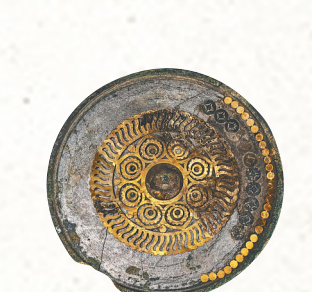
董韶容墓出土的金银平脱镜。本版图片均为资料图