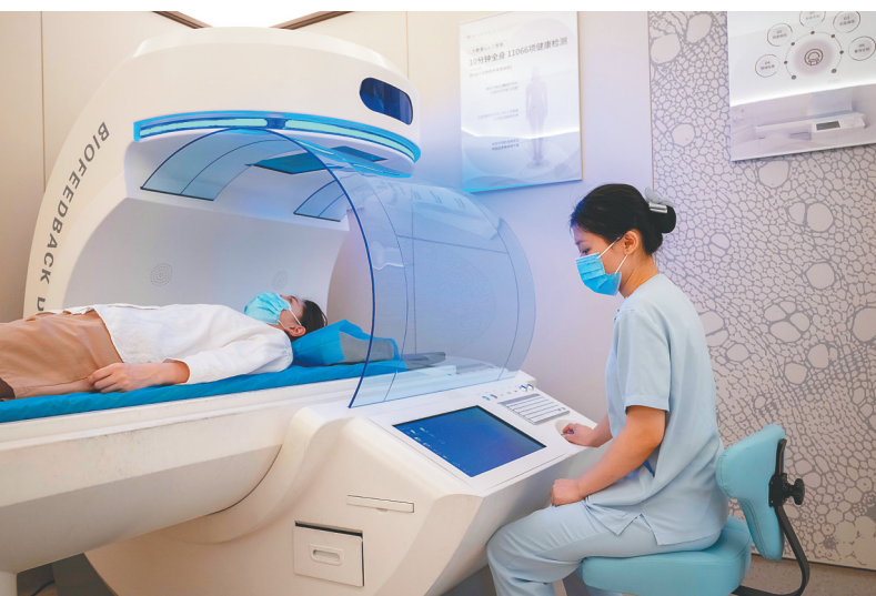
患者在乐城一家医院接受检查。