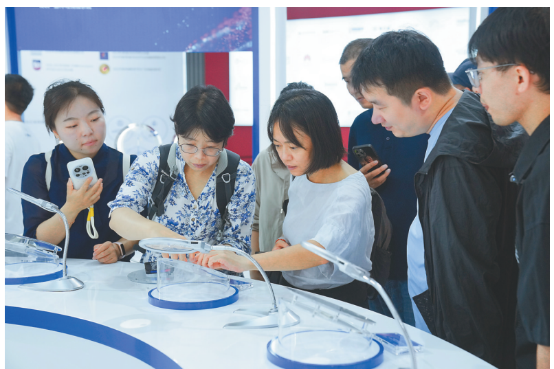
嘉积观摩乐城“永不落幕”国际创新药械展。