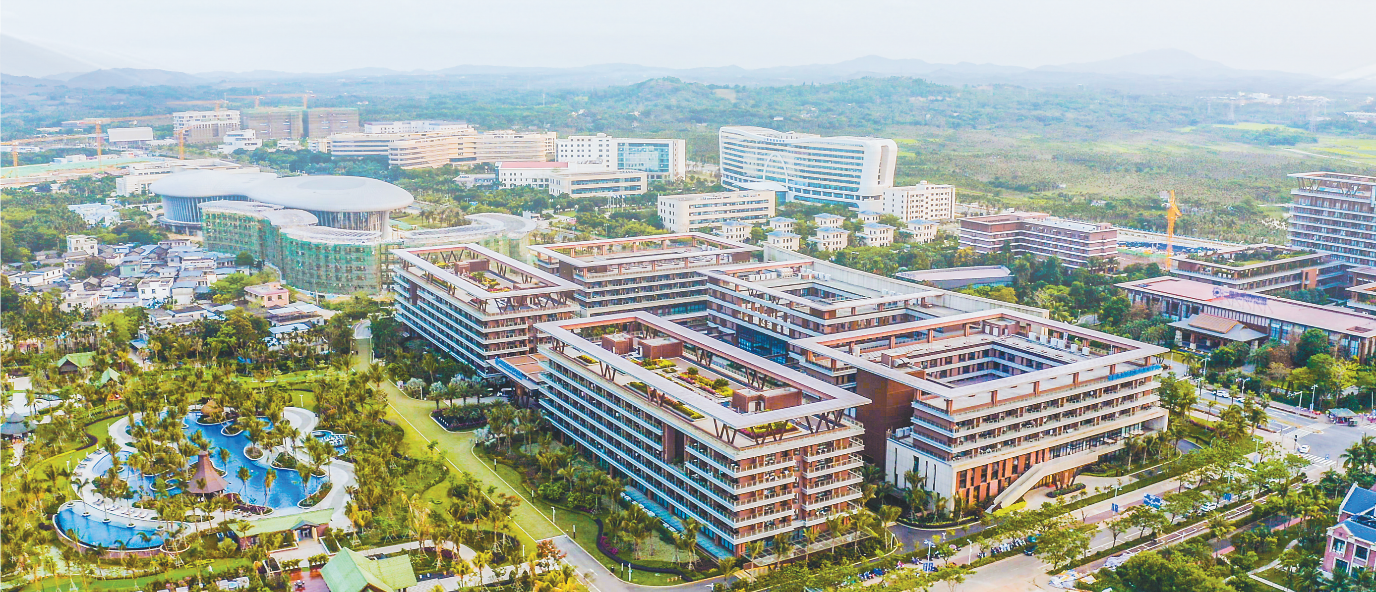
俯瞰博鳌乐城国际医疗旅游先行区。