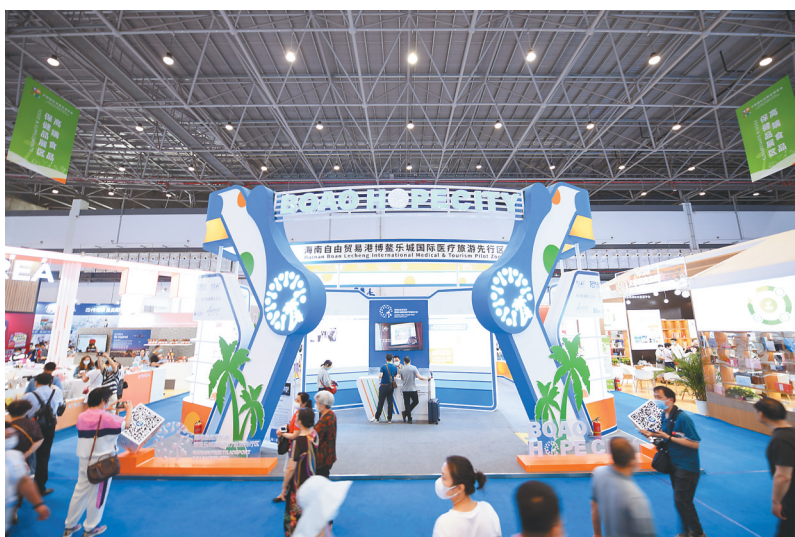
中国国际消费博览会上乐城展馆。