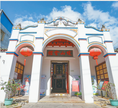
陵水琼山会馆旧址(陵水县苏维埃政府旧址)。