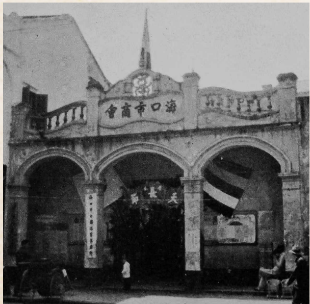
1930年,海口总商会更名为海口市商会。

民国《琼山县志》插图上福建会馆、五邑会馆的大致位置。海南省典籍整理与研究基地特约研究员何以端标注。