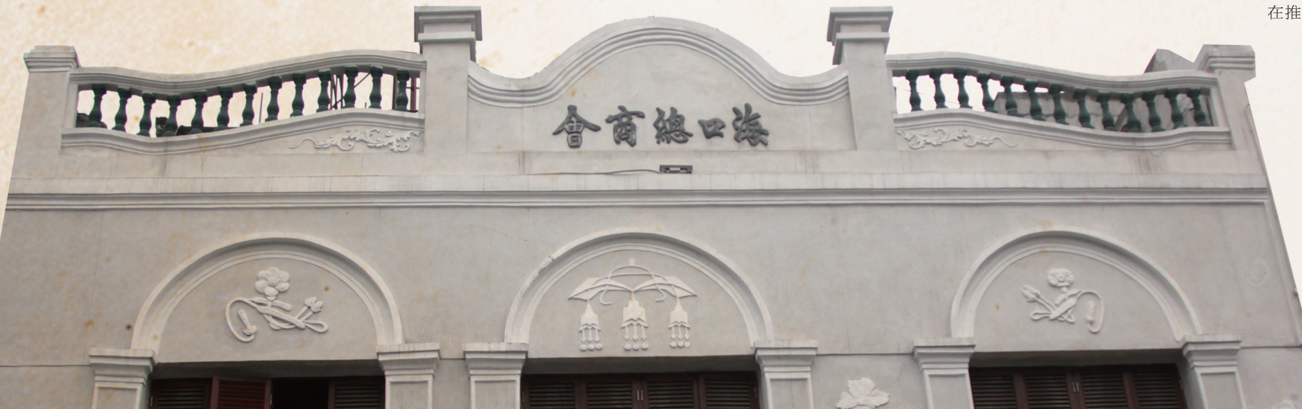
海口总商会旧址。