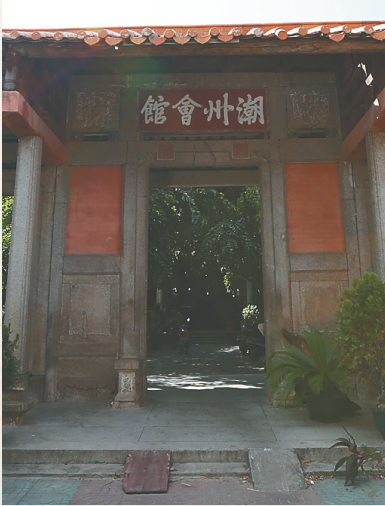
万宁潮州会馆旧址。本版图片除署名外均为资料图