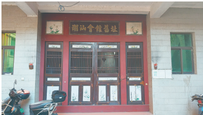
海口潮汕会馆旧址。