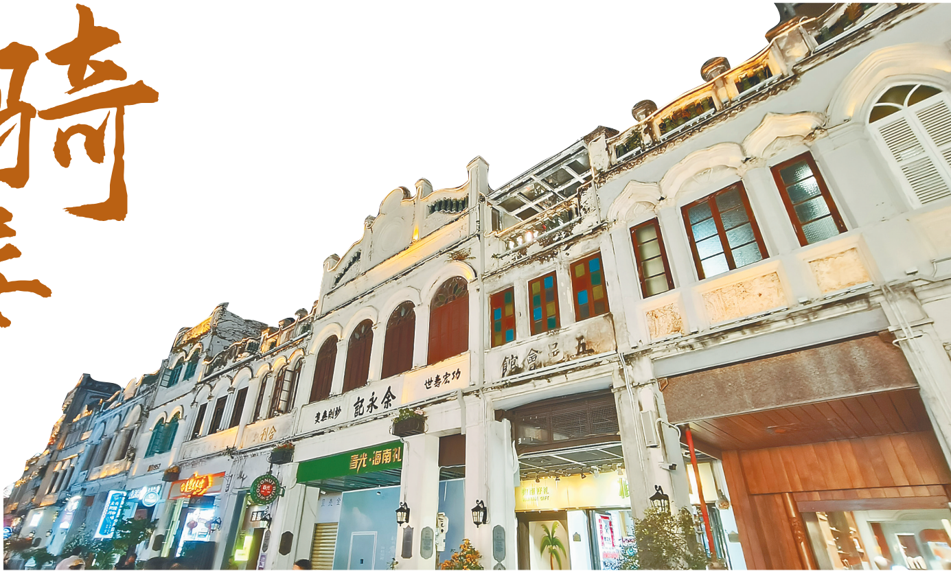
海口骑楼老街临街立面上有“五邑会馆”字样。