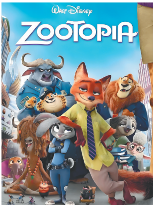
《疯狂动物城》海报。

甚至会陪着你一起疯,并且在你犯下一些错误,甚至做出一些伤害他情感的事情时,同样会默默包容和原谅你。