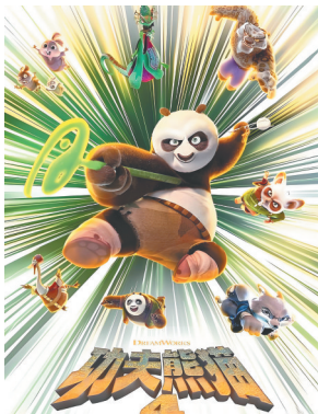
《功夫熊猫4》预告片海报。

事实上,也正是这样的设定,使得二人在第二部中的感情发展,成为了“健康伴侣教科书”一般的存在。尼克丰富的生存智慧,对朱迪那些充满活力的急躁行为的包容,以及随处可见的对朱迪用心的小细节,都让这个角色有了某种深沉的魅力。他就像是生活中那些沉稳却细心的伴侣,虽然踏实务实,但也会为了你的疯狂而动容,