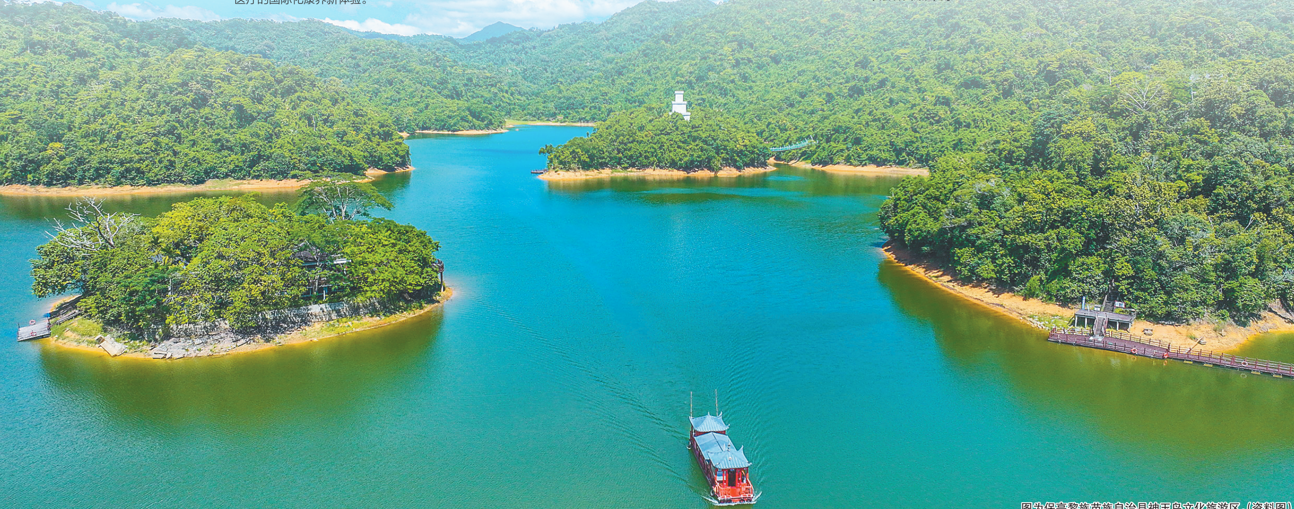
图为保亭黎族苗族自治县神玉岛文化旅游区。(资料图)

方案①: 机场巴士②号线(海棠湾专线)三亚凤凰机场乘机场巴士→海棠湾301医院打车→三亚保利国际博览中心 方案②: 自驾/打车约50分钟车程