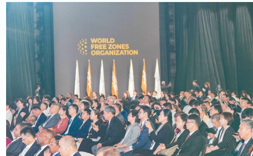
10月10日,第十一届世界自由区组织大会在海口开幕。

相关厅局和市县园区,利用省领导出访契机,在日本、阿联酋、新加坡、西班牙、意大利、美国以及中国香港、中国澳门等地策划举办海南自贸港推介会、政策解读会、产业对接交流会等活动。依托境内外代表处、第三方合作机构的资源渠道优势,策划举办外资企业海南行活动。 构建“全球络网”。今年9月,海南国际经济发展局粤港澳(香港)代表处正式挂牌成立。海南国际经济发展局发挥新加坡、德国以及我国粤港澳、京津冀、长三角等境内外代表处驻点优势,与全球超过50个国家驻华经商机构、我国驻全球100多个主要国家和地区经商机构、境外商协会、境内外贸促机构及金融机构等建立常态化联络机制,全方位拓展各类招商引资渠道。 攻坚外资重点项目。围绕封关运作政策机遇,海南国际经济发展局组建了旅游消费、医疗健康、清洁能源、数字经济等多个国际招商专班,聚焦重点领域精准招商,紧盯德国西门子能源、新加坡富隆集团、星嘉坡武集团、同程集团等一批企业及项目,实行“一对一”全程跟踪服务,促成不少合作落地。 德国西门子能源去年在海南成立分公司以及创新中心后,今年继续深化与海南的合作;今年2月,省政府与同程集团在海口签署战略合作框架协议,围绕文旅产业基金项目、中国国际消费品博览会等深化合作;今年6月,省政府与新加坡富隆集团在新加坡签署战略合作协议,推进医疗健康等领域合作;今年10月,三亚市与星嘉坡武集团在澳门签约,将打造三亚蔚蓝动力运动休闲度假区项目…… “海南自贸港启动封关运作,向各界释放了更加积极的信号,我们十分看好海南自贸港的独特政策、文旅资源和国际化营商环境。”星嘉坡武集团董事长兼首席执行官、北京寰聚商业管理有限公司董事长何献君表示,将主动发挥星嘉坡武和寰聚商业的专业优势和行业资源,助力海南电竞、直播、演出、旅游、会展等产业上下游协同发展。