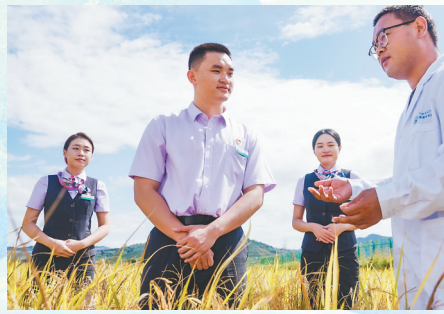
农行海南分行客户经理与南繁科研人员一同查看水稻生产情况。