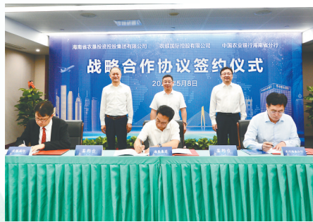
农行海南分行会同农银国际与海南省农垦投资控股集团有限公司签署战略合作协议。

椰风拂碧海，潮涌自贸港。近年来，农行海南分行主动对接海南省委、省政府决策部署，推动农业银行与海南省政府战略合作协议落地，以高质量发展为引领，将金融服务深度融入自贸港建设全局，以“全行办国际业务”协同之力、“重点领域深耕”务实之举、“民生服务提质”暖心之策，全力打造服务自贸港的优质银行品牌，用一串串坚实的数据、一幕幕暖心的场景，为海南自贸港建设注入源源不断的金融动能，书写着国有大行的责任与担当。