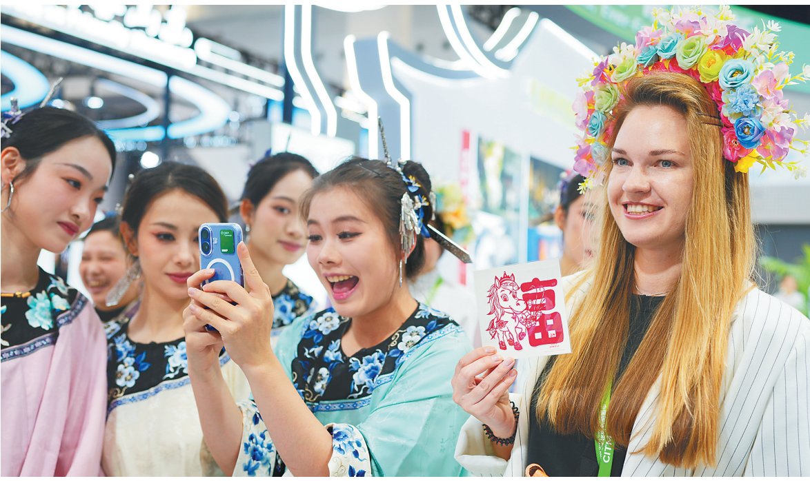
2025年12月19日,2025中国国际旅游交易会在海口开幕,参会外籍嘉宾头戴鲜花开心留影。据了解,这是海南自贸港全岛封关正式启动后,海南举办的首场高规格旅游盛会,吸引了来自101个国家和地区的1000余名旅行社及代表参会。