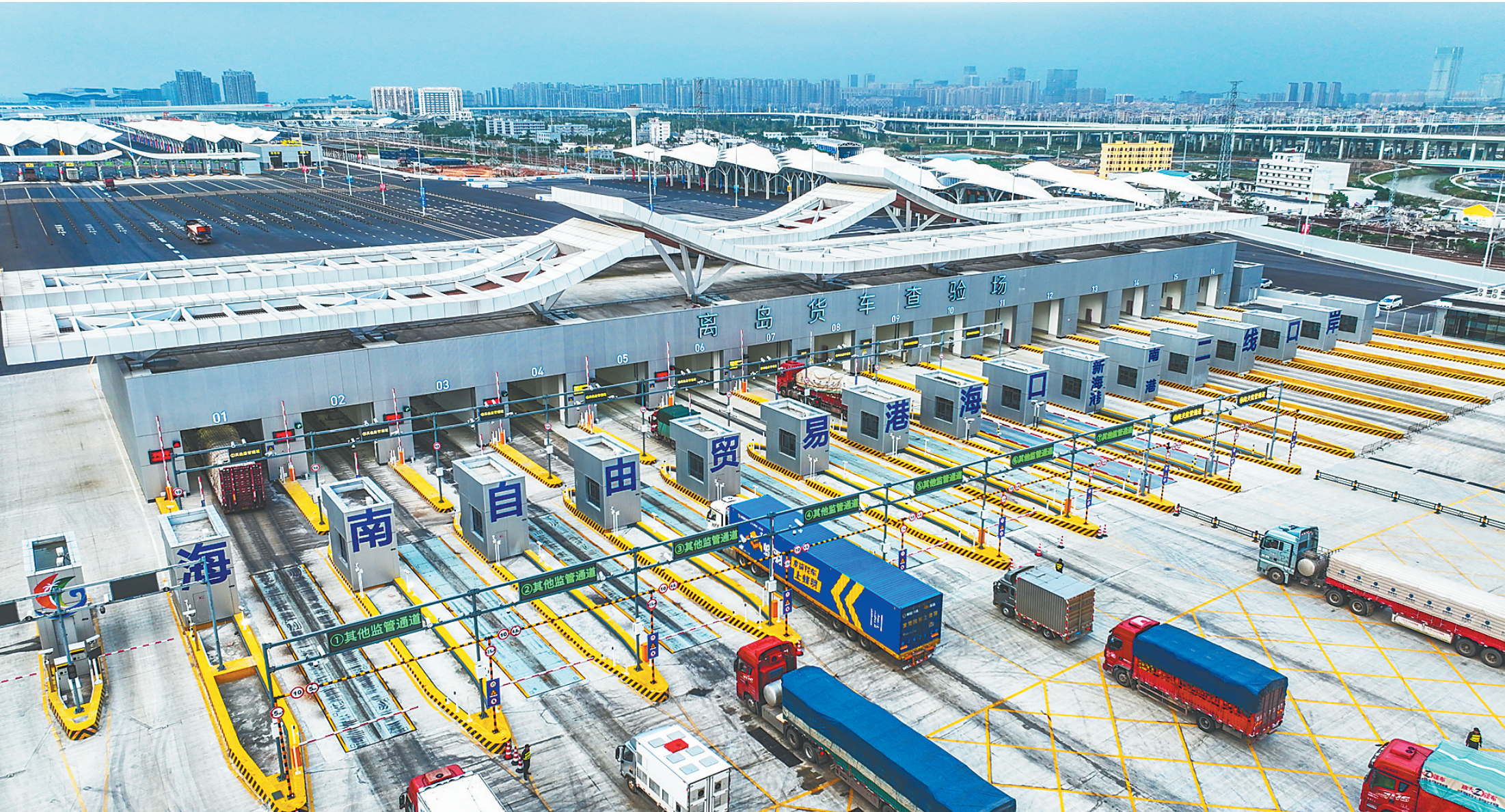
2025年12月18日,出岛货车有序经过海口新海港和南港“二线口岸”(货运)集中查验场。当天,海南自由贸易港正式启动全岛封关,这里承担着海南全岛约80%的货车出岛任务。