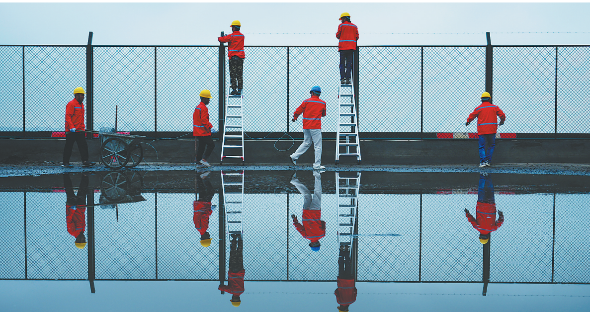
2023年5月8日,在海口港(秀英港区),工人们紧锣密鼓推进海南全岛封关运作的围网建设。该工程是海南全岛8个对外开放口岸和10个“二线口岸”运行的关键基础设施。封关后,海南全岛将建成一个海关监管特殊区域,实施以“一线”放开、“二线”管住、岛内自由”为基本特征的自由化便利化政策制度。