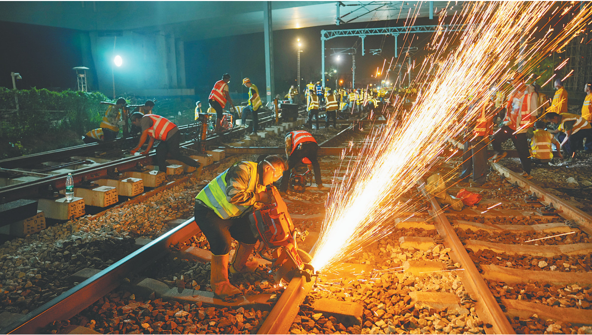
2024年11月12日,位于海口市粤海大道1号的海口站,300多名工人在深夜里开展铁轨切割、拨移与连通等作业。这是海口南港“二线口岸”(普铁旅客)查验设施建设的关键环节,该口岸是海南岛内外联通的重要枢纽,对海南全岛封关运作意义重大。