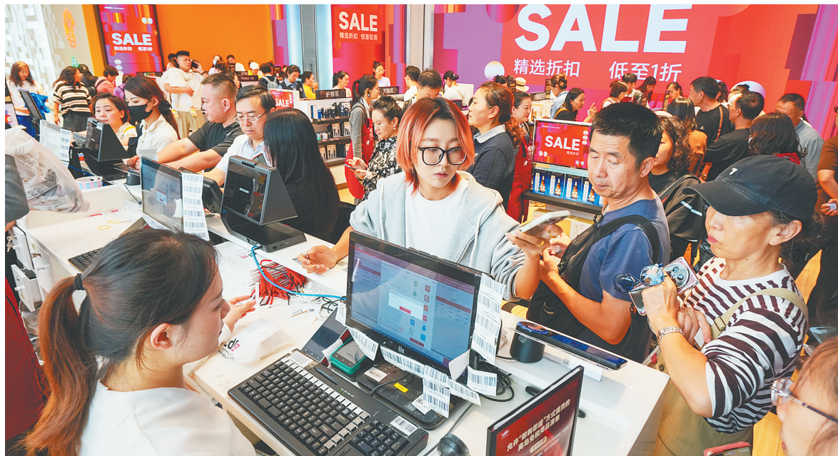
2025年12月18日,海南自贸港正式启动全岛封关当日,消费者在cdf海口国际免税城选购免税商品。海口海关19日发布统计数据,海南全岛封关首日,海南离岛免税购物金额1.61亿元,同比上涨61%。