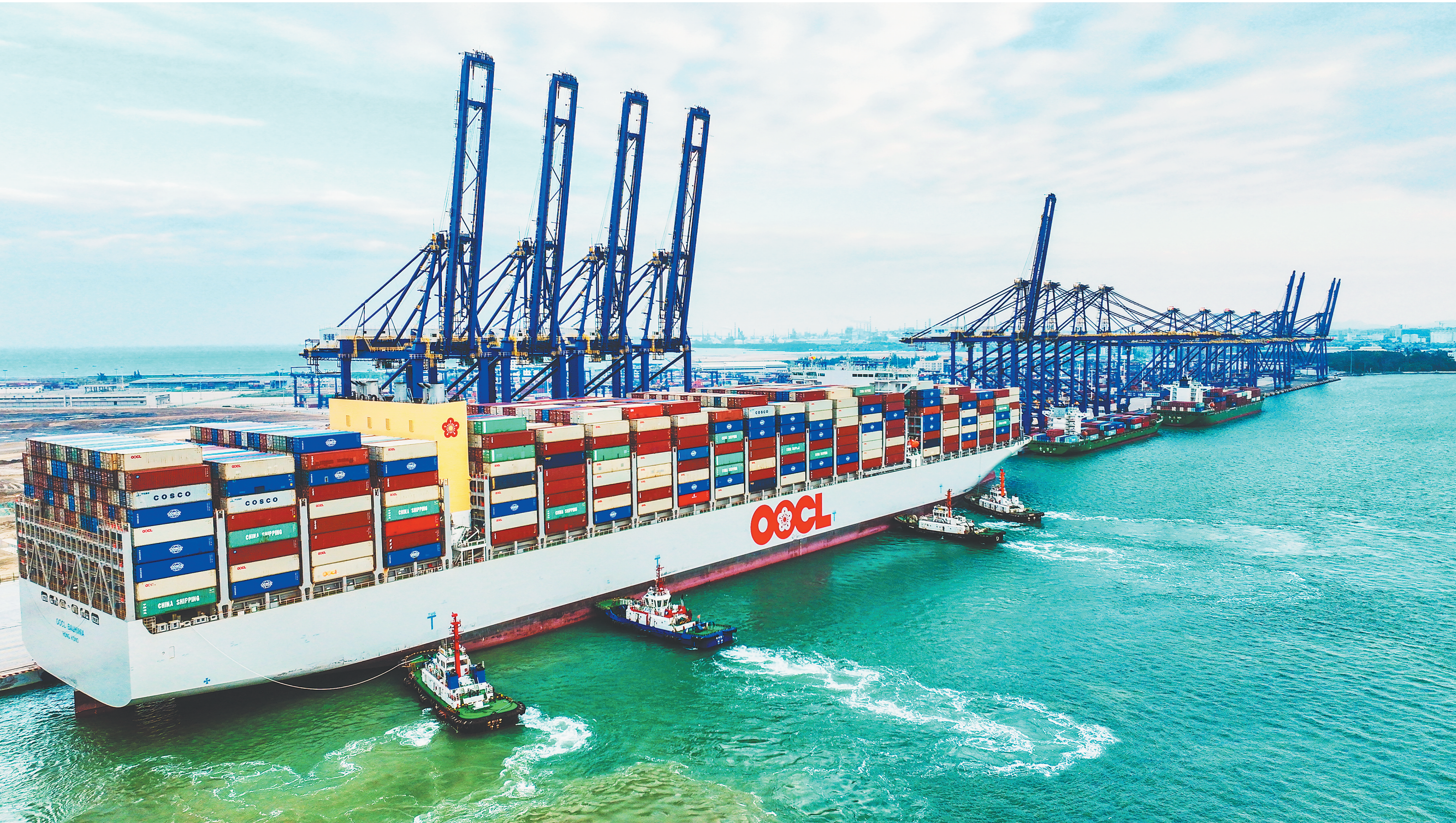
2025年11月23日,一艘满载集装箱的15万吨级国际航行船舶在拖轮的协助下,缓缓靠泊海南洋浦国际集装箱码头。作为自贸港“样板间”,洋浦承接了全岛超七成的进口货物量,成为海南乃至中国扩大高水平对外开放的一个生动缩影。