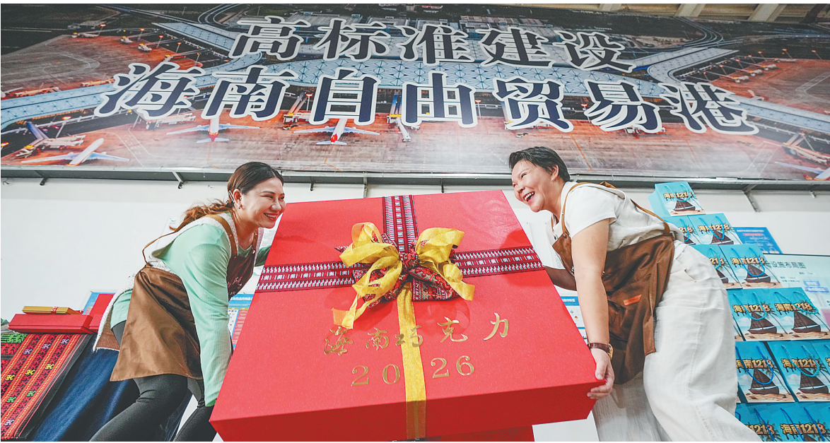
2025年12月18日,海口美兰机场“二线口岸”,工作人员共同打开海南巧克力大礼包。当天,海南自贸港全岛封关正式启动,这批巧克力由海南一家外商投资食品企业生产,经海关监管通道高效通关。这是海南自贸港全岛封关后,海口美兰机场“二线口岸”第一批通关的加工增值内销免关税货物。