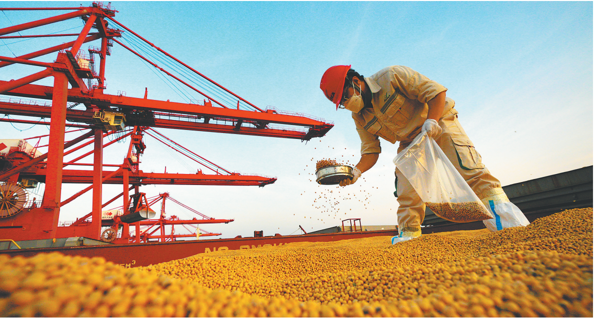
2025年11月26日,在国投洋浦港5号泊位,报关员对一批来自国外的大豆进行抽检。这批大豆将在自贸港内的企业加工,并享受加工增值内销免关税政策。该政策是海南自贸港最具“含金量”的政策之一,进口料件在海南自贸港加工增值超过30%(含)的货物,经“二线”进入内地免征进口关税。