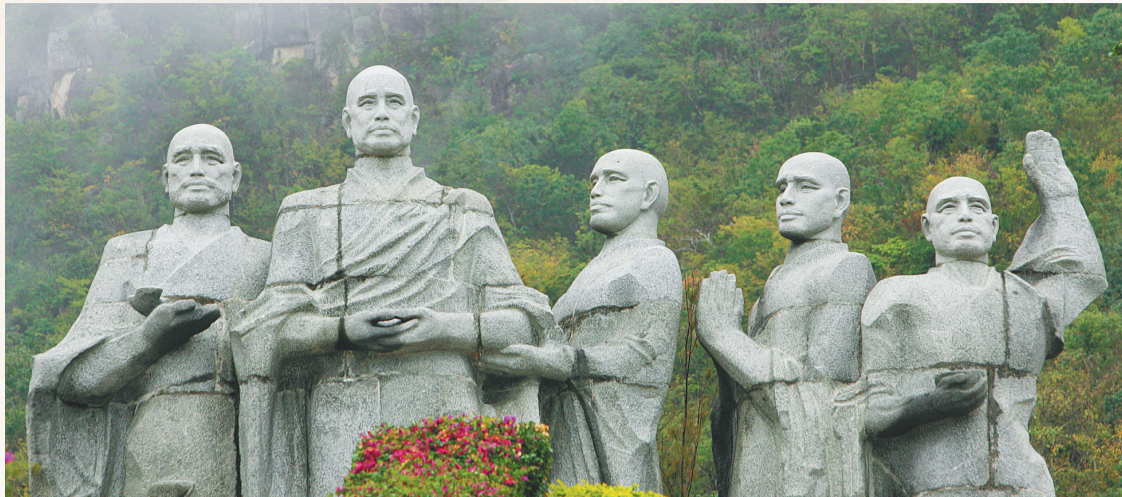
三亚大小洞天旅游区鉴真东渡雕塑（2006年）。