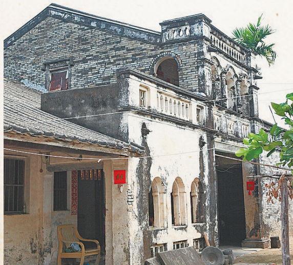
三亚水南村一角。资料图

对于这位曾身居高位的宰辅而言，这无疑是人生的断崖式跌落。从繁华的汴京到“孤悬海外”的崖州，千里迢迢的路途，不仅是空间的跨越，更是从权力巅峰到蛮荒之地的心理落差。然而，正是这场命运的放逐，让卢多逊与三亚结下了生死相依的缘分。