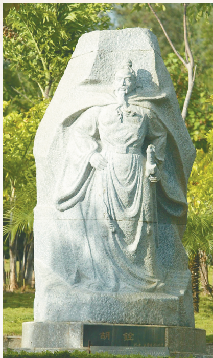
三亚天涯海角游览区里的胡铨雕像。