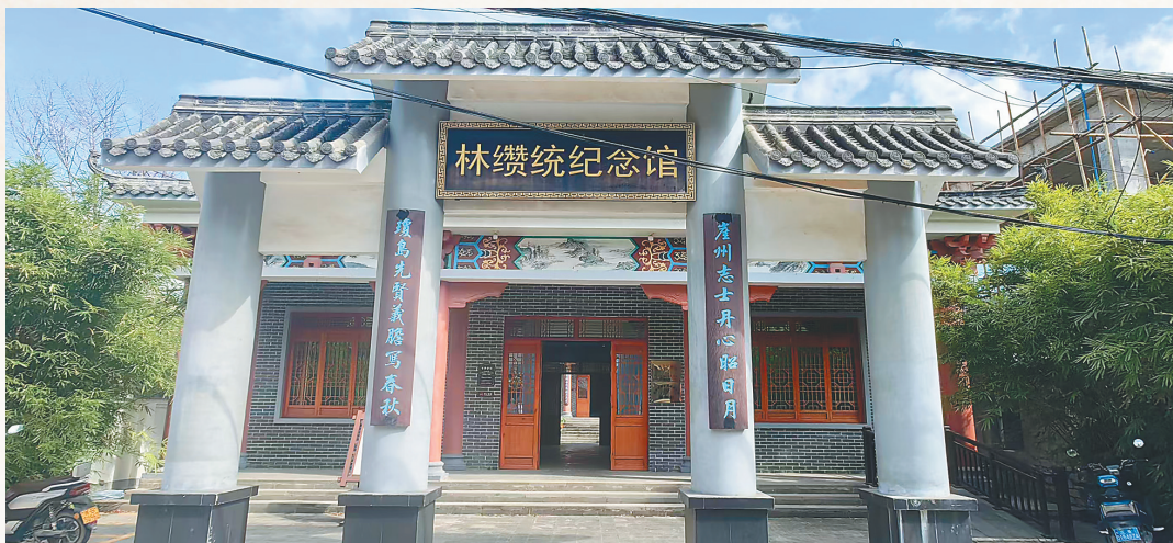
三亚林纘统纪念馆。黄媛艳 摄