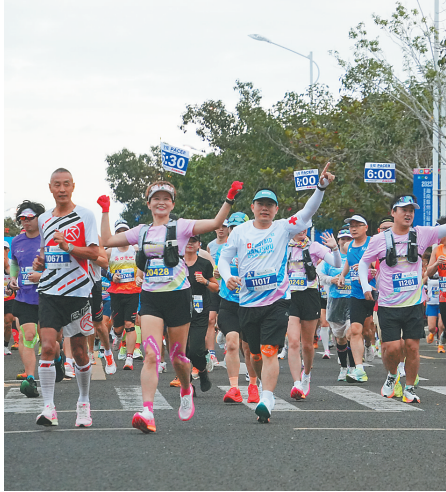
2025儋州马拉松现场，选手在比赛中。

儋州马拉松赛已成功跻身“中国田协A类赛事”“世界田联银牌赛事”行列。伴随着海南自贸港全岛封关的开放信号和儋洋一体化高质量发展的深入，本届儋马启用全新赛道，首次从那大城区迁移至环新英湾地区。全新的滨海景观赛道从洋浦滨海文化广场出发，依次途经洋浦大桥、春马大桥、北门江特大桥、海南环岛旅游公路新英湾支线等，六段沿海路段、九处观景点被串联成一条“珍珠赛道”。奔跑其上，红树林美景相伴，白鹭鸟鸣声相和，跑者不仅能纵情感受新英湾风光，还能饱览儋洋一体化建设风貌，感受城市发展速度与脉搏。