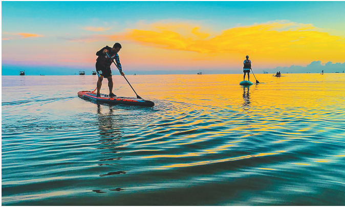
游客在儋州神冲村玩水上项目。