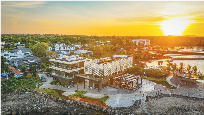
夕阳下的儋州神冲村美不胜收。

石头，这个村庄最不起眼的成员，终于在新的浪潮里，醒了过来，发出属于自己的光。（本报那大12月24日电）