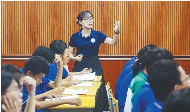
青年教师在给上课。

师资梯队的稳固，为一体化改革提供了有力保障，而多元实践的开展，则让改革理念真正走进课堂。2025年3月至4月，学校举办覆盖初高中全学科的教研组公开课，29节示范课吸引700余人次参与听评课。依托智能教研平台，AI自动采集12项课堂行为数据，整理成100余份校本资源，为精准评价与教研提供量化支撑。学校还特邀海南中学骨干教师入校指导，专家深入6个学科课堂观摩，提出28条改进意见，分享“分层作业设计”“错题归因分析”等实操策略，为改革精准把脉。