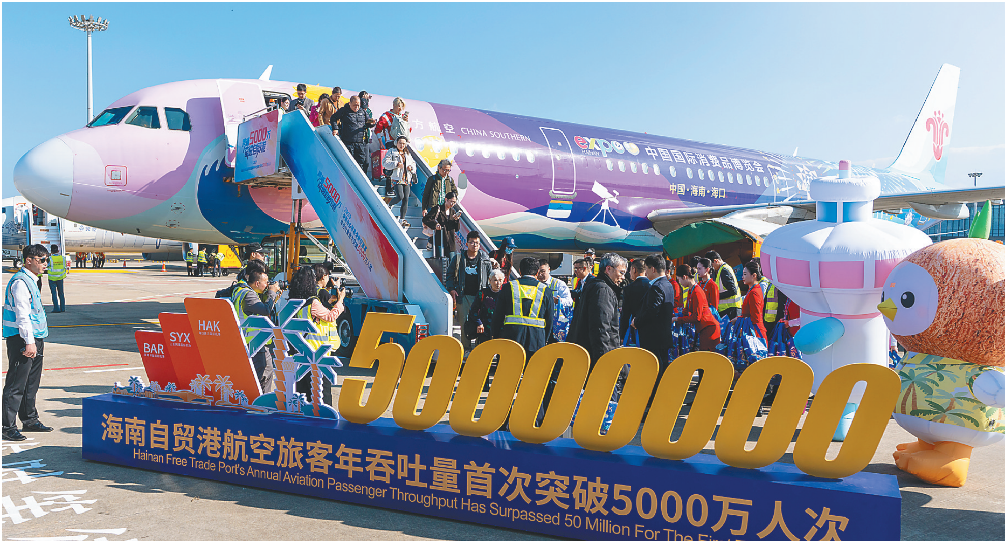
12月30日，南方航空成都至海口航班平稳落地海口美兰国际机场。