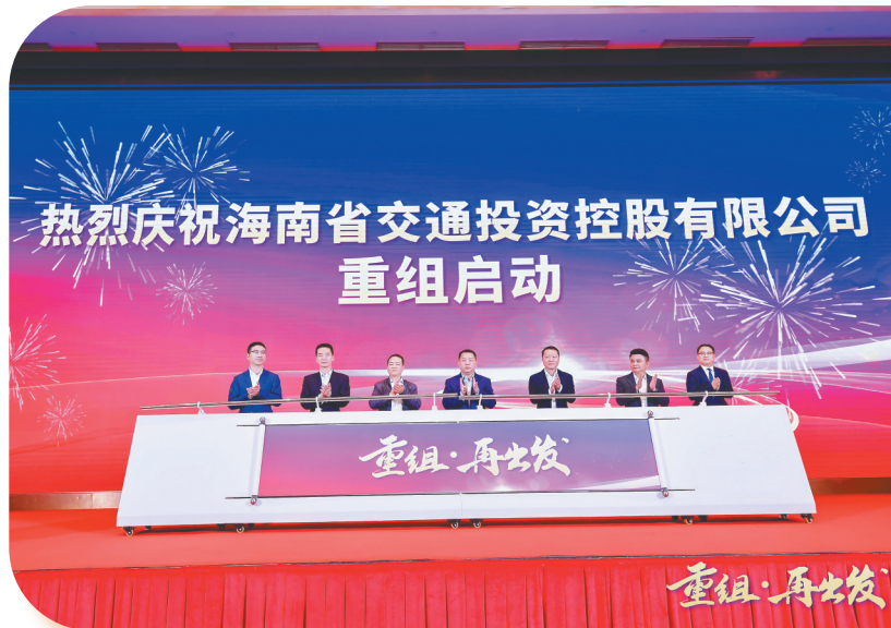
2024年12月31日，海南省交通投资控股有限公司重组启动。

新质生产力培育壮大。战略性布局数字交通、绿色交通、低空交通等前沿领域，打造“车路云一体化”应用试点消博会示范项目，投资建设陵水海底智算中心，承办中国智能交通大会，赋能智慧海南建设。积极响应海南“三纵三横三出岛”低空航线网络布局，统筹推动低空与交通融合发展，构建“低空天网”，以公路养护为试点逐步拓展至低空旅游、物流等特色场景。推进八所港高排港区防波堤工程、琼州海峡中水道航道浅点疏浚工程、湛海高铁等重点项目建设，开辟“向海图强”新质生产力新赛道。