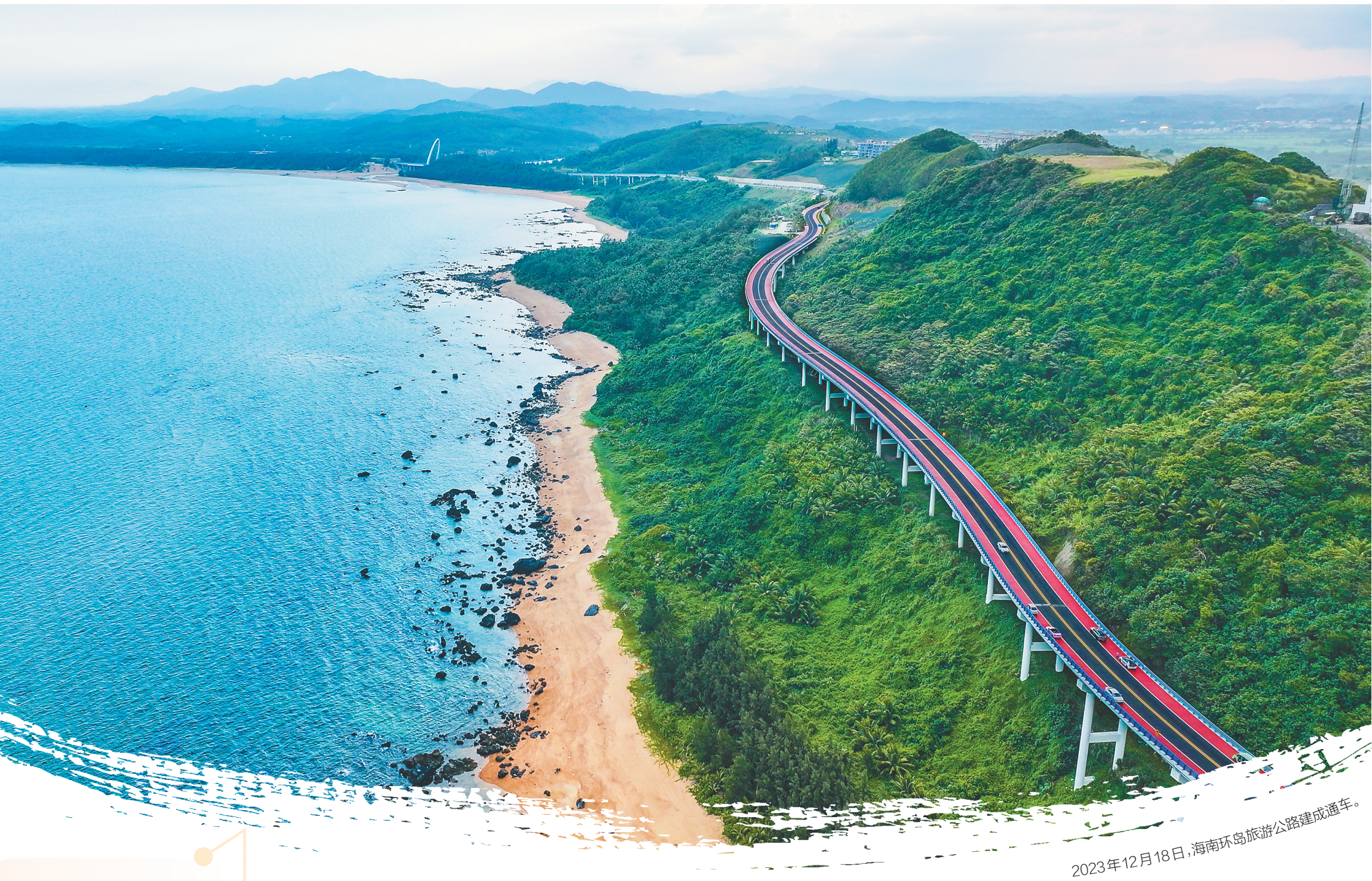
2023年12月18日，海南环岛旅游公路建成通车。

潮起海之南，风正好扬帆。 今日琼州，高质量发展的强劲动能在基础设施的坚实支撑中越发澎湃——