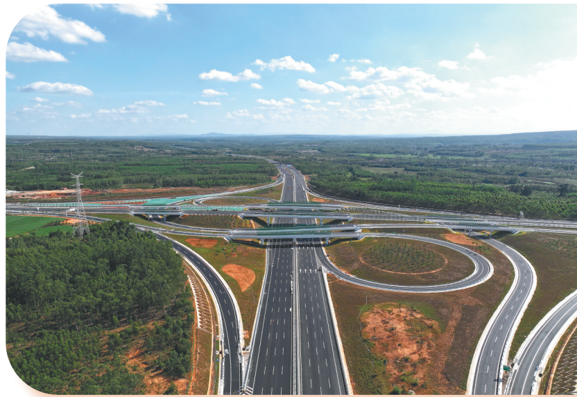
2025年12月30日，全省第一条双向八车道高速公路——洋浦疏港高速公路项目建成通车。