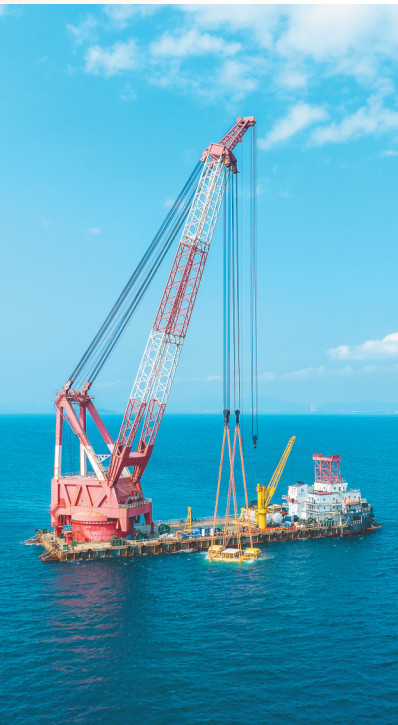
2025年2月18日，海底智算中心在海南陵水海域完成海底智算舱下水。

人享其行，物畅其流。“十四五”以来，在省委、省政府的坚强领导下，海南交通集团坚持以“加快建设交通强国海南样板”为战略使命，坚持以党建为统领，以高质量发展为根本要求，以加快公司改革发展为主线，聚焦主责主业，优化产业结构布局，成为海南省交通投资建设运营及交通综合服务龙头企业，为高质量建设海南自贸港注入澎湃交通动能。