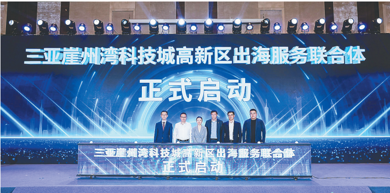
在科技城举行的封关运作政策宣介暨合作签约活动上，出海服务联合体成立。