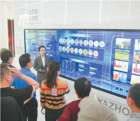
2025年11月7日，中国侨商投资(海南)大会东线考察团嘉宾在科技城实地参观。