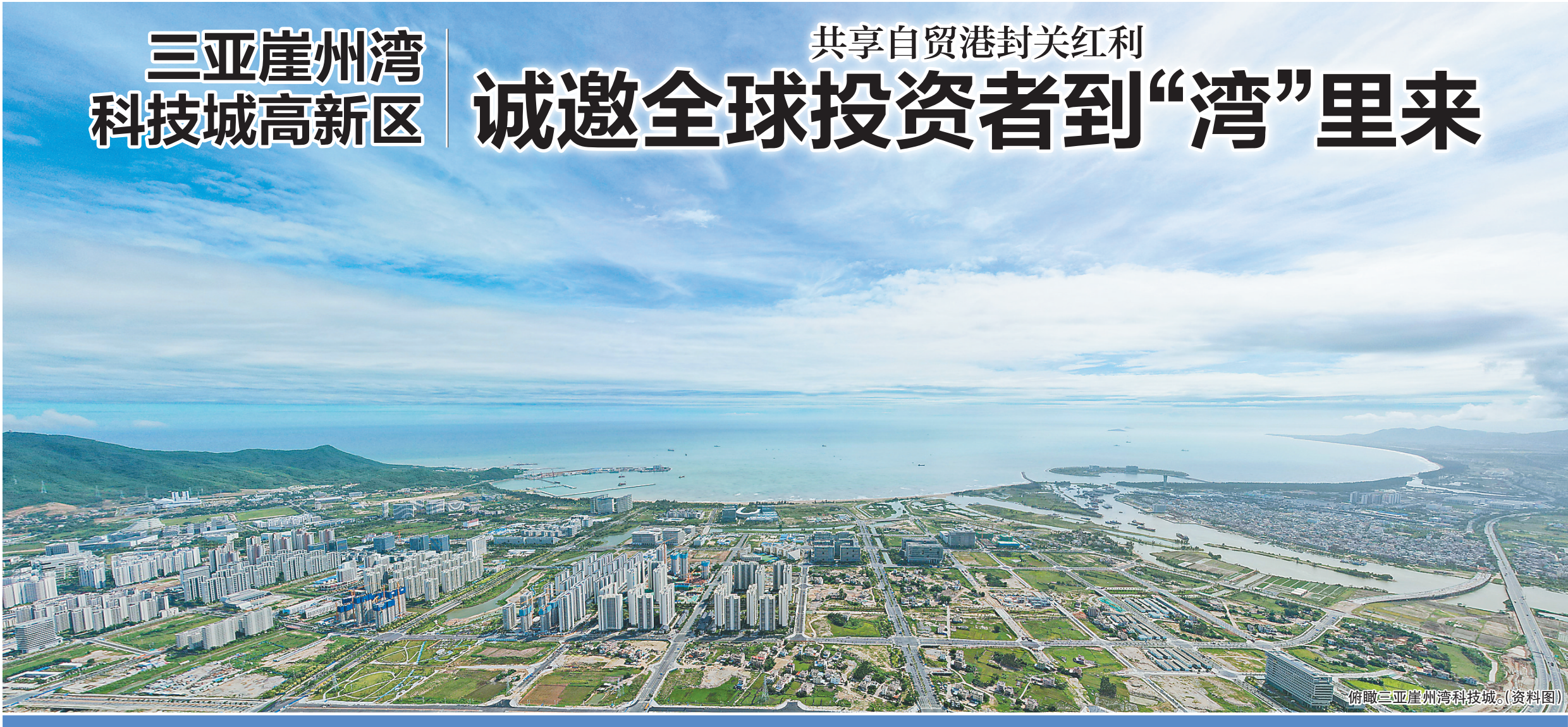
俯瞰三亚崖州湾科技城。(资料图)