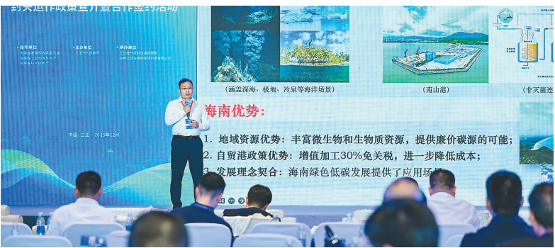
科技城举行封关运作政策宣介暨合作签约活动，与会嘉宾在发言。