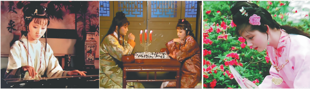
本组图片均为87版电视剧《红楼梦》剧照。

从去年下半年开始,关于著名导演郑晓龙即将翻拍名著《红楼梦》的消息就一直备受关注,从影视圈的专业人士到隐于网络中的《红楼梦》原著粉,纷纷对这部小说的翻拍提出了自己的建议。鉴于2010版电视剧《红楼梦》遭遇的诸多争议,大家给出的意见不约而同地聚焦在了同一个点上:把控细节。细节决定成败,也是决定《红楼梦》这种大部头小说能否翻拍成功的决定因素之一。当年2010版《红楼梦》出炉时,剧中世家小姐梳戏子的铜钱头、不分季节地乱穿纱质衣服就引发了观众的极度不适。一部《红楼梦》,于普通读者而言,就是一场浏览繁华日常的剧目:黛玉的琴、迎春的棋、宝玉香囊里的沉香……我们今日就借远处传来的几声昆曲,去大观园的一隅看看吧。