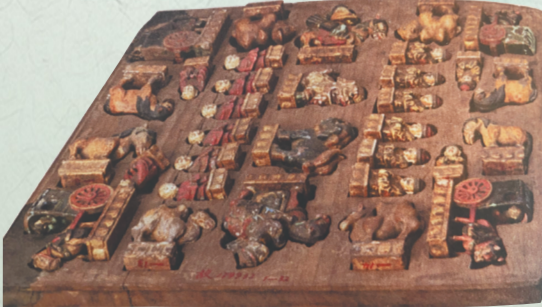
木彩漆象棋子。