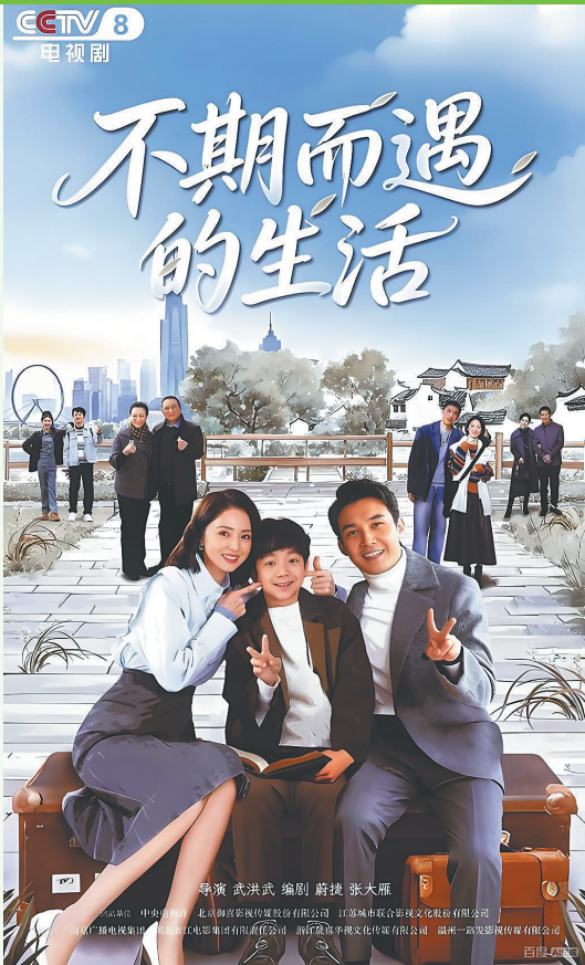
《不期而遇的生活》海报。