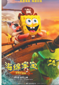
《海绵宝宝：深海大冒险》海报。