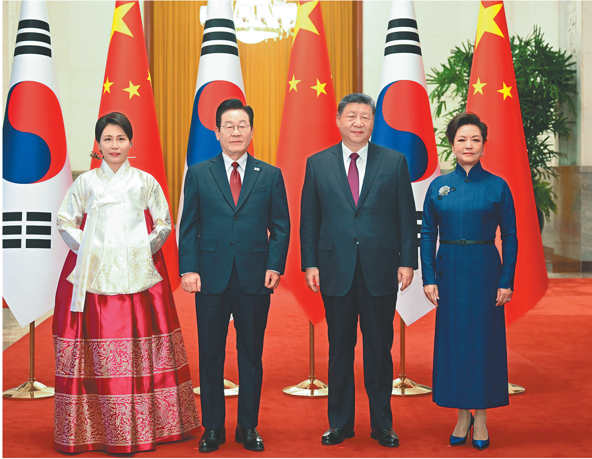
一月五日下午，国家主席习近平在北京人民大会堂同来华进行国事访问的韩国总统李在明举行会谈。这是会谈前，习近平和夫人彭丽媛同李在明和夫人金惠景合影。