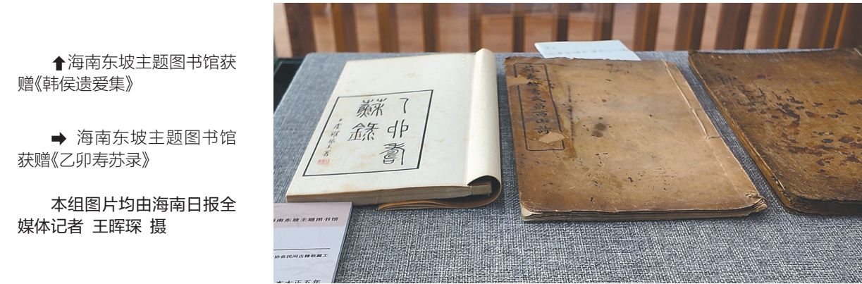
↑海南东坡主题图书馆获赠《韩侯遗爱集》