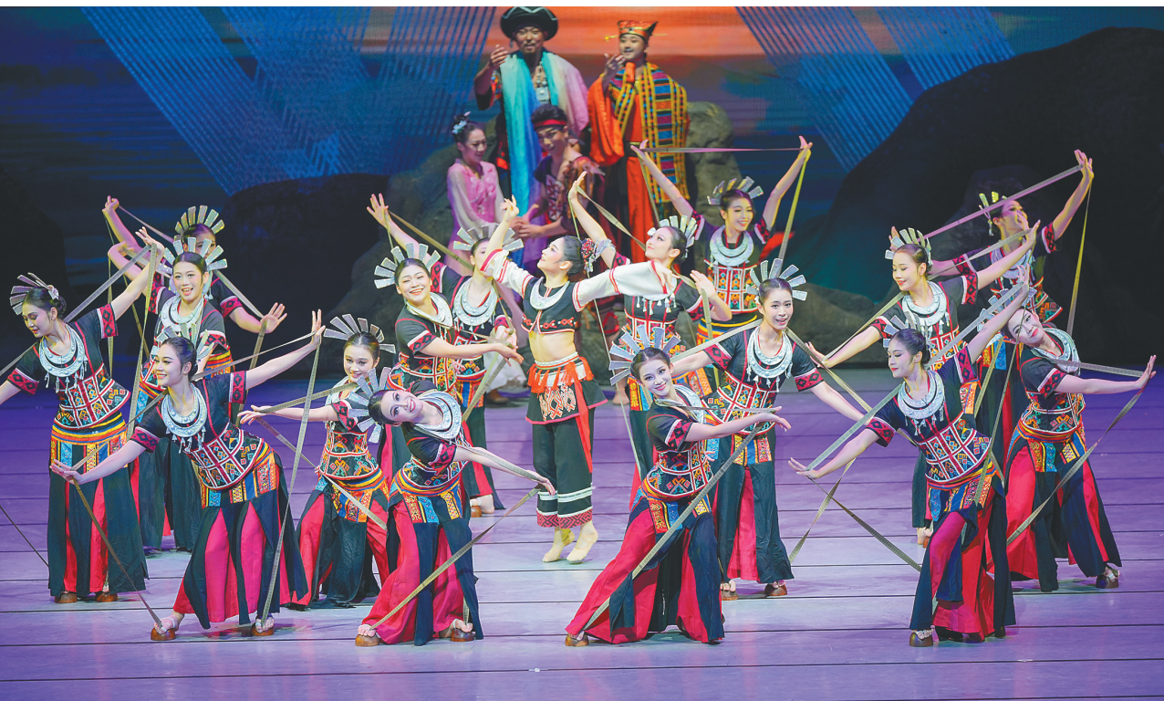
原创民族舞剧《黄道婆》复排首演

时代脉搏、遵循发展规律,切合海南自由贸易港实际,既有战略高度,又具实践深度,更富民生温度,是引领全省上下团结奋斗的行动指南,必将进一步激发全省上下的奋斗热情,汇聚起昂扬拼搏的磅礴力量。省政协将更好发挥专门协商机构作用,对标报告和规划纲要科学制定年度工作要点,完善年度协商计划和民主监督计划,全力助推省委、省政府决策部署落地见效,为实现“十五五”良好开局贡献政协智慧与力量。 省领导杨国强、肖莺子、李国梁、陈马林、侯茂丰、袁光平、骆清铭,省政府秘书长蔡强,省政协秘书长罗时祥参加座谈会。