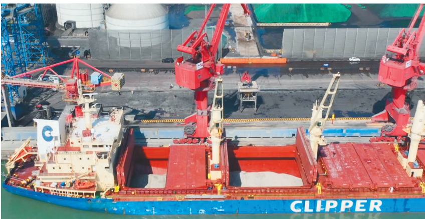
封关后洋浦首批“零关税”锂精矿抵港卸货。

本报洋浦1月9日电(海南日报全媒体记者吴心怡)1月9日,一艘从非洲马里出发、装载着28950吨锂精矿的船舶抵达国投洋浦港,将为海南星之海新材料有限公司(以下简称星之海)年产2万吨电池级氢氧化锂项目提供稳定的生产原料。这是海南自贸港全岛封关后,洋浦首批以“零关税”申报入境的新能源矿产。 据了解,这批锂精矿是星之海通过其母公司海南矿业旗下马里布谷尼锂矿进口的首批货物,此次进口标志着海南矿业新能源一体化产业链正式打通关键环节。 此次进口是星之海成为“零关税”政策受惠企业后,“零关税”进口的首批货物,为企业生产降低了成本。该公司副总经理廖青松表示,未来公司将深化“两头在外”业务模式,从海外进口锂精矿等核心原材料,在海南自贸港内完成加工生产,最终面向全球市场供应电池级氢氧化锂产品。“这种模式既能借助零关税政策大幅降低原材料进口成本,又能充分发挥自贸港的区位优势 and 港口物流便