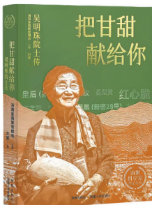
《把甘甜献给你——吴明珠院士传》 作者:刘颖 编者:海南省南繁管理局 版本:海南出版社 新疆人民出版社 时间:2025年1月