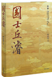
《国士丘濬》 作者:何杰华 版本:海南出版社 时间:2025年3月