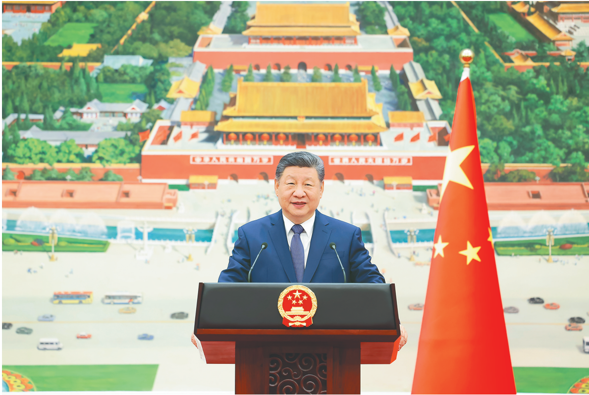
一月十六日上午，国家主席习近平在北京人民大会堂接受十八位驻华大使递交国书。这是仪式结束后，习近平在北京厅对使节们发表讲话。

新华社北京1月16日电（记者曹嘉玥）1月16日上午，国家主席习近平在北京人民大会堂接受18位驻华大使递交国书。人民大会堂北门外，礼兵庄严肃立，迎宾号角吹响。使节们相继抵达，穿过旗阵，沿汉白玉台阶拾级而上。 在巨幅壁画《江山如此多娇》前，习近平分别接受使节们递交国书，并同