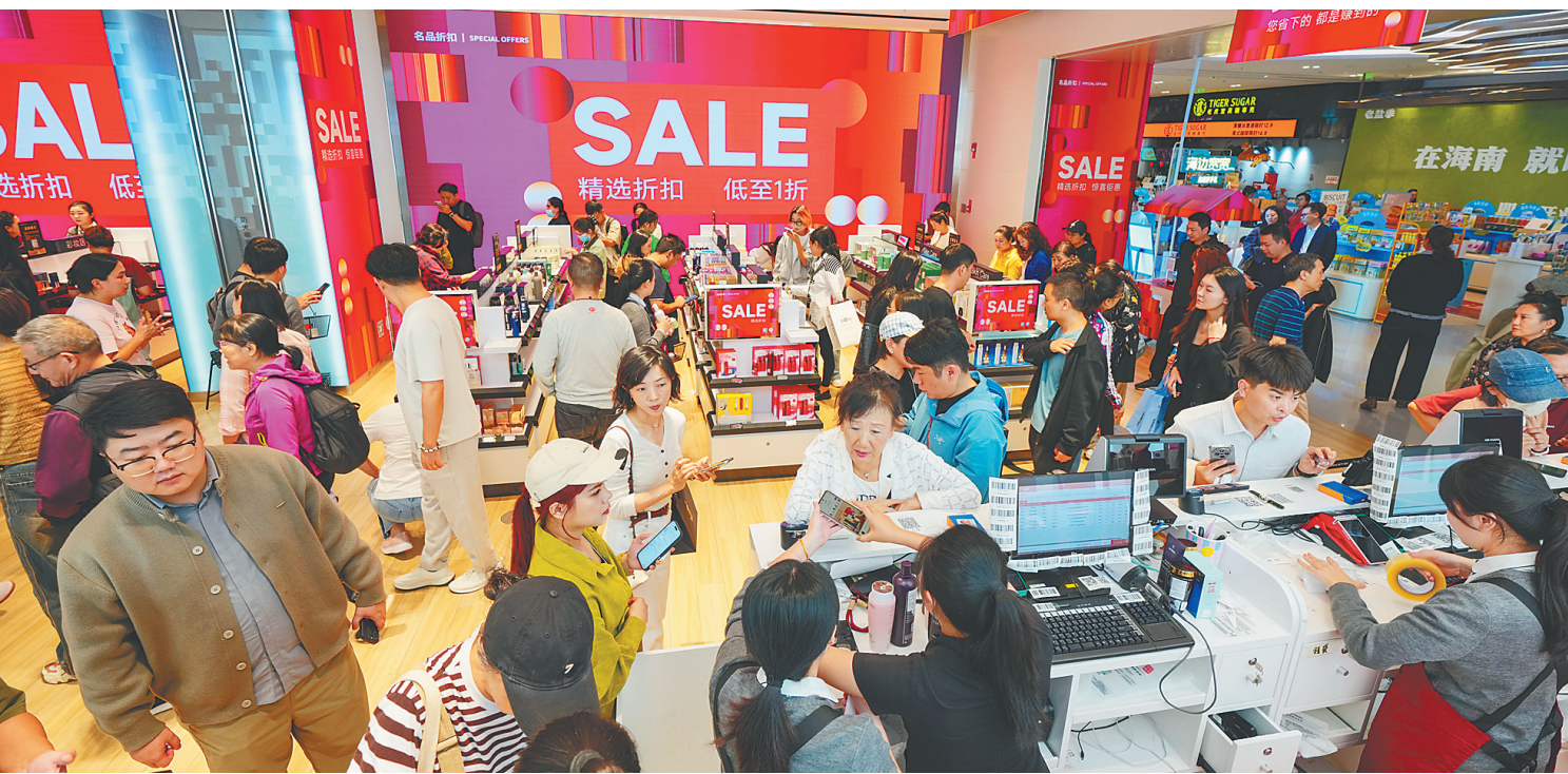
2025年12月18日，消费者在cdf海口国际免税城选购免税商品。