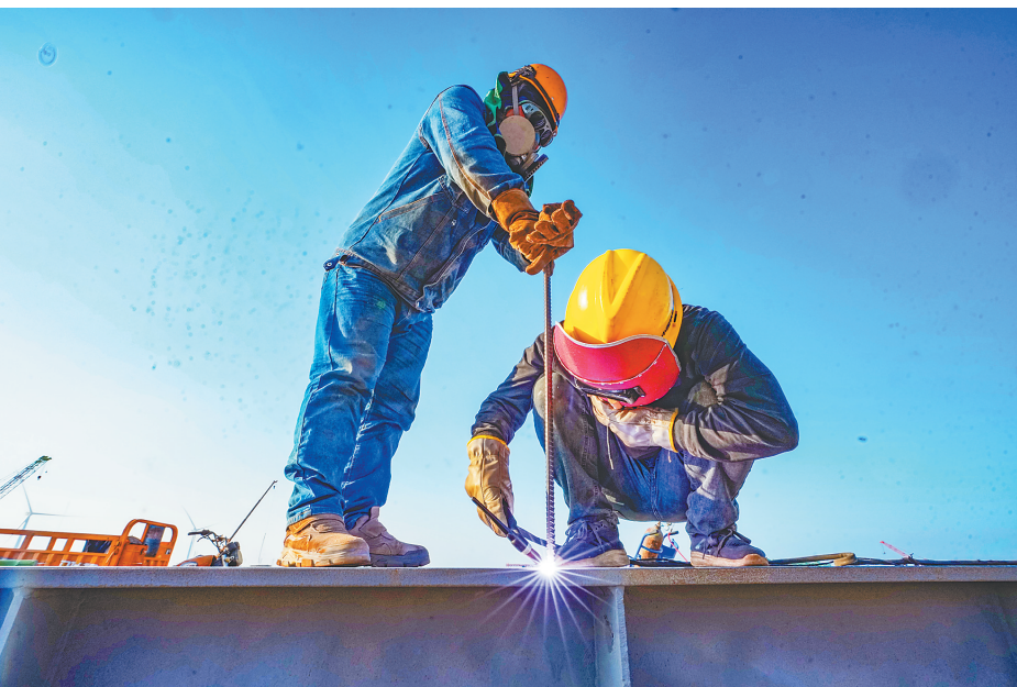
1月12日，在临高金牌港开发区港口及配套工程项目一期工程现场，施工人员加紧推进码头引桥主墩建设。