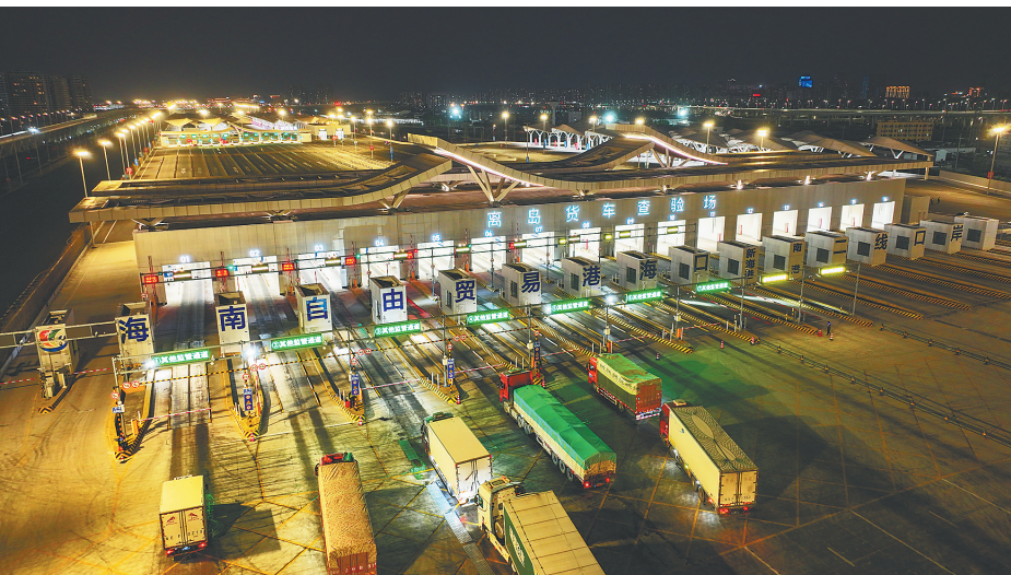
1月1日，海口新海港和南港“二线口岸”货运集中查验场一派繁忙。