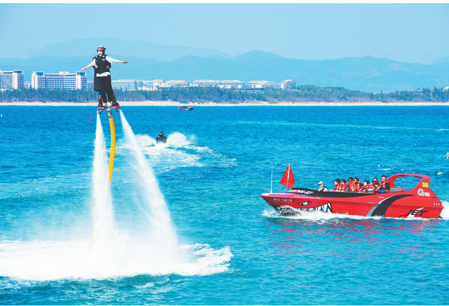
1月8日，三亚蜈支洲岛景区，游客正在体验水上运动项目。