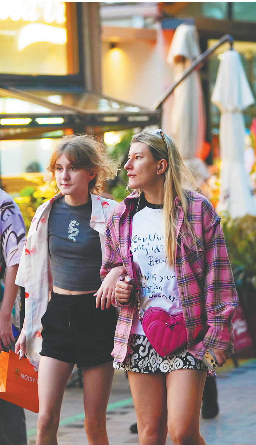
1月2日，三亚市鹿回头风景区，国内外游客前来游玩。