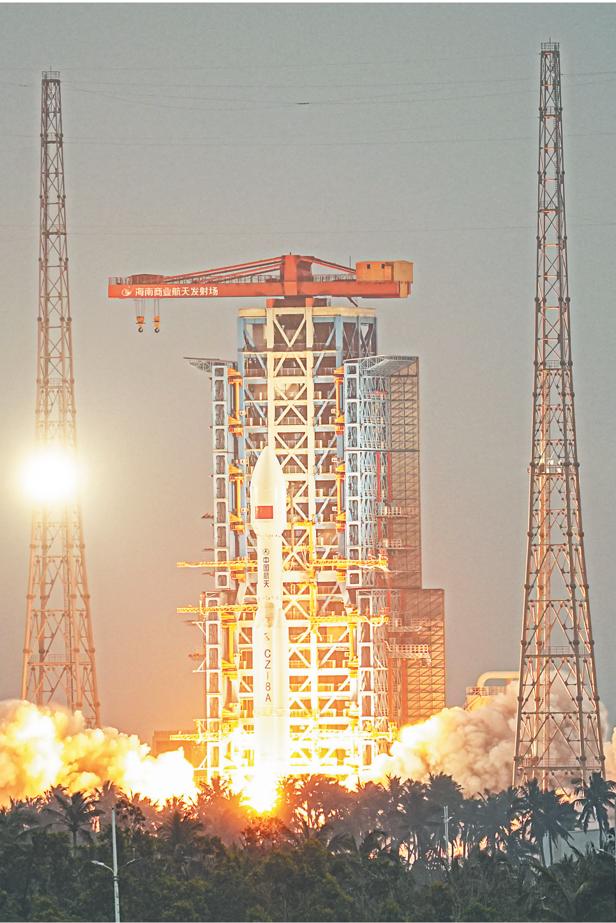
2025年12月26日，我国在海南商业航天发射场使用长征八号甲运载火箭，成功将卫星互联网低轨17组卫星发射升空，卫星顺利进入预定轨道，发射任务获得圆满成功。