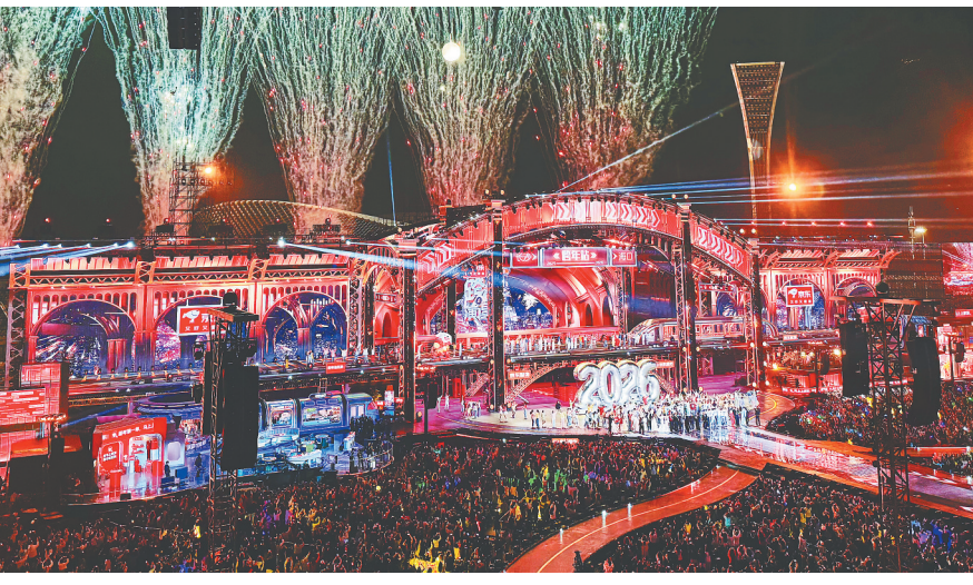
2025年12月31日晚，2025-2026湖南卫视芒果TV跨年演唱会在海口五源河体育场热情开唱。