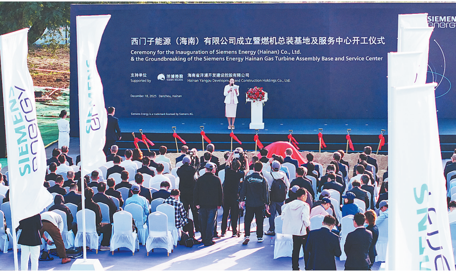
2025年12月18日，世界五百强企业——西门子能源在洋浦经济开发区举行燃机总装基地及服务中心开工仪式。