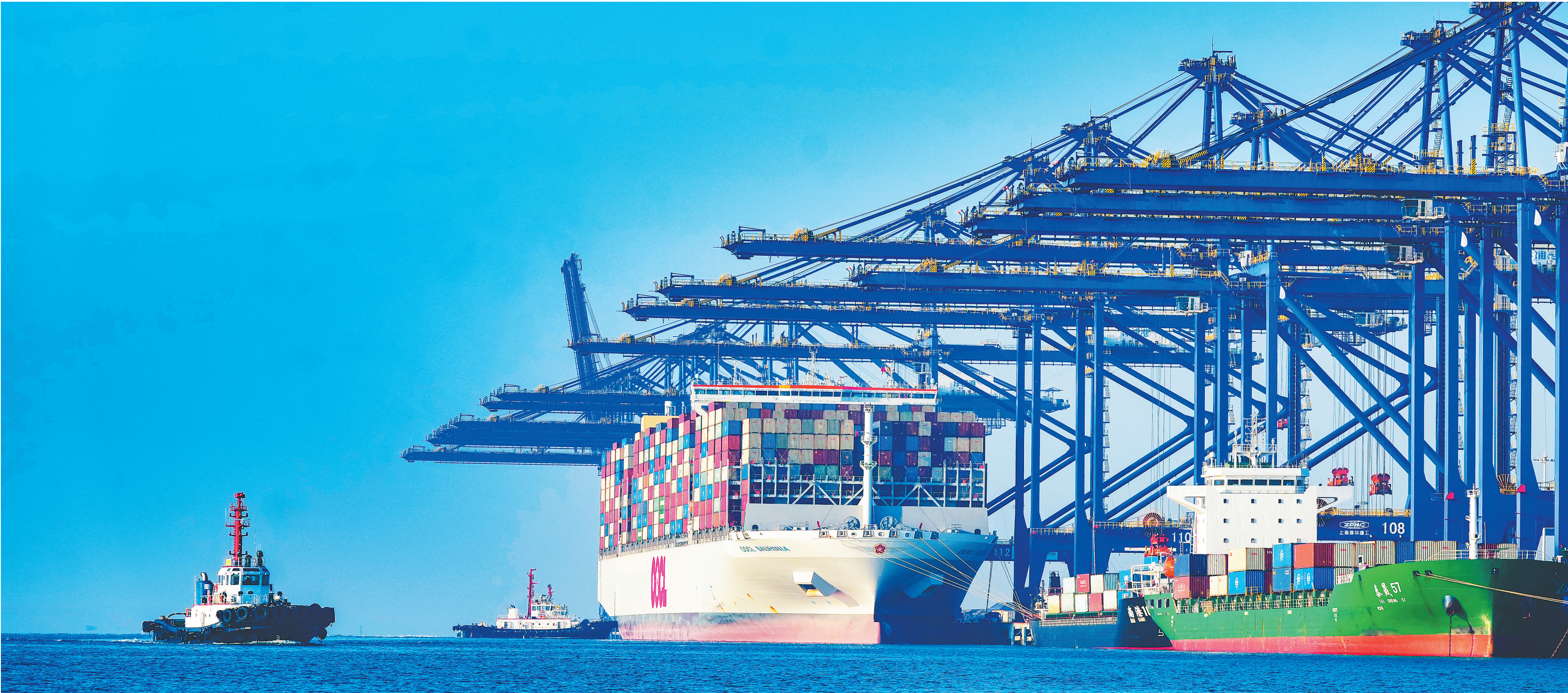
1月11日，“东方紫荆花”轮平稳靠泊洋浦国际集装箱码头。海南日报全媒体记者 陈元才 摄