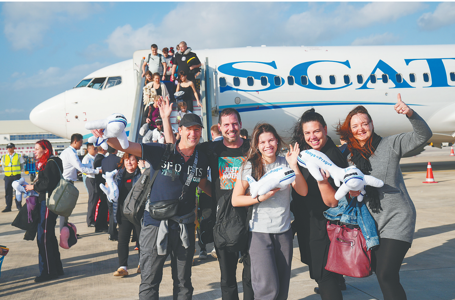
2025年12月22日16时06分，首批第七航权航班旅客从捷克布拉格飞抵三亚。