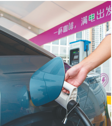
在位于深圳巴士集团深康充电站内的超充站，工作人员为一辆新能源汽车插枪充电。

当前，随着新质生产力加速落地，高端制造业正成为拉动用电增长的核心引擎。 2025年新能源车、风电设备制造领域用电量增速分别超过20%和30%；与此同时，数字经济与新兴技术的迅猛发展，催生了一批新的用电增长点，充电桩、5G基站等新型基础设施建设提速，带动互联网和相关服务业用电量同比增长超30%，充换电产业用电量增速更是接近50%。 这些数据背后，是我国产业结构向高技术、高附加值方向的加速转变，新兴产业释放的澎湃活力，正为经济高质量发展注入源源不断的动能。 面对总量攀升与结构升级带来的双重电力负荷考验，电力系统的平稳有序运行，成为守护这10万亿千瓦时“成绩单”的关键支撑。目前，我国已构建起“电源—电网—需求”三侧协同发力的保供体系： 在电源侧，煤电兜底保障作用持续稳固，水电、核电、火电协同出力筑牢基本盘，风光新能源则作为增量主力，依托抽水蓄能、新型储能快速部署，实现出力波动的有效平抑； 在电网侧，迎峰度夏、迎峰度冬前的设施检修维护毫不松懈，重点输