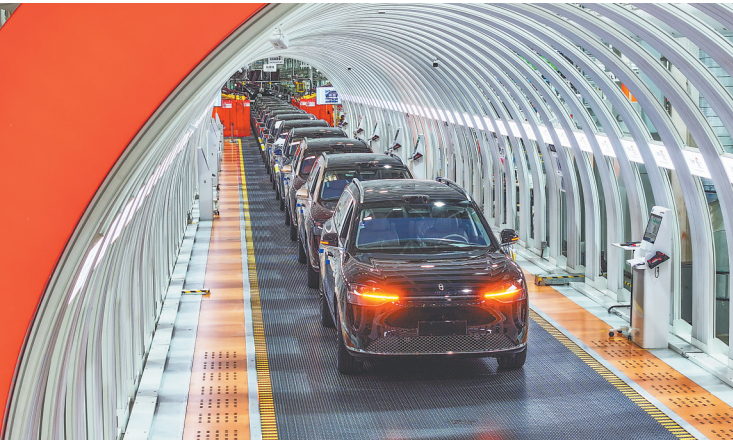
在重庆市两江新区的赛力斯汽车超级工厂拍摄的即将下线的新能源汽车。

国家能源局17日宣布，2025年我国全社会用电量历史性突破10万亿千瓦时，达到10.4万亿千瓦时，同比增长5%。 这一数字在全球单一国家中尚属首次，相当于美国全年用电量的两倍多，超过欧盟、俄罗斯、印度、日本四个经济体的年用电量总和。 作为经济运行的“晴雨表”，这一里程碑式的跨越，直观彰显出中国超大规模经济体的强劲韧性，更清晰映照出产业结构升级、经济绿色转型的前行轨迹。 用电量总量突破的背后，是多重因素的共同驱动。 中国电力企业联合会常务副理事长杨昆指出，宏观经济稳中向好的基本面，为用电增长筑牢了坚实基础，而持续高温天气叠加终端电气化水平的提升，则进一步拉动了生活用电需求的攀升。正是这两股力量的交织，让2025年7月、8月连续两个月全社会用电量突破万亿千瓦时，创下全球范围内的新纪录。 更值得关注的是，年用电量从5万亿千瓦时到10万亿千瓦时，我国仅用了十余年时间，这样的增长速度在全球主要经济体中绝无仅有，既印证了我国作为制造业大国的发展底色，也折射出能源保障能力的全面提高。