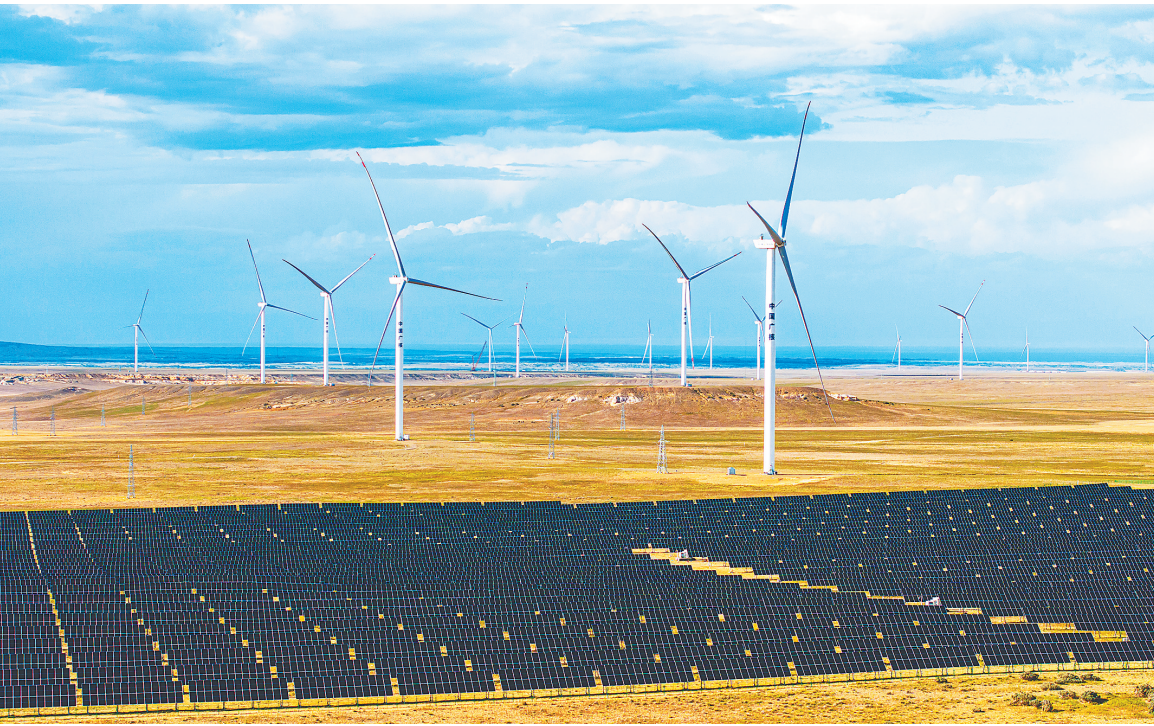
在新疆阿勒泰地区吉木乃县拍摄的50万千瓦时风电项目配套输电线路建设现场。