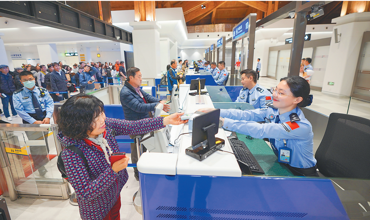
近日,三亚凤凰出入境边防检查站民警为旅客办理入境手续。