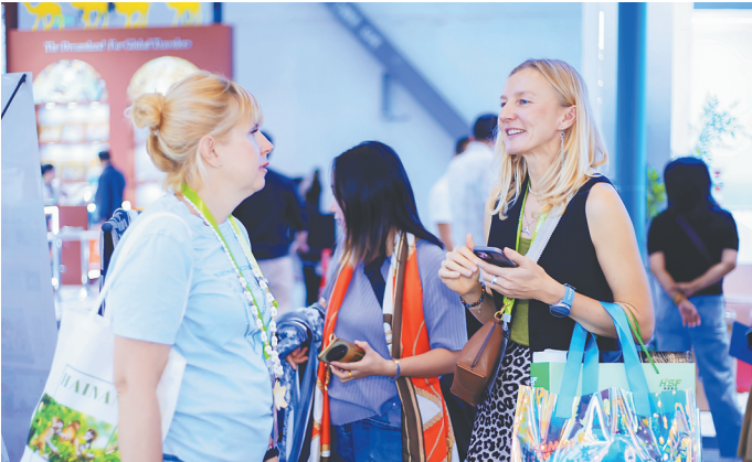
2025中国国际旅游交易会在海口举办,吸引了来自101个国家和地区的1000余名旅行社及代表参会。