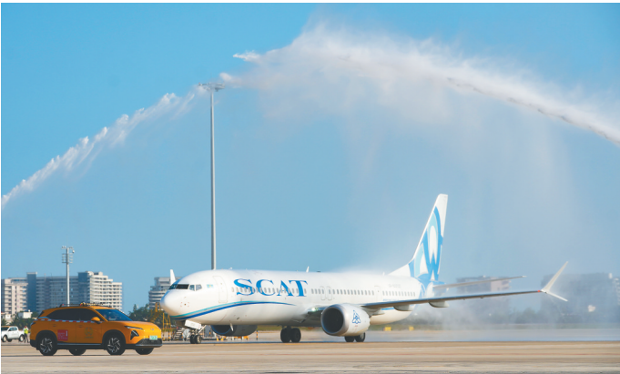
三亚凤凰国际机场举行过水门仪式,迎接全国首批第七航权航班旅客的到来。

数字背后,是一幅细腻、生动且富有纵深感的游客图景——随着海南国际旅游消费中心建设的不断推进,外国人不仅来得更多,而且住得更久,足迹更广,玩得更深。