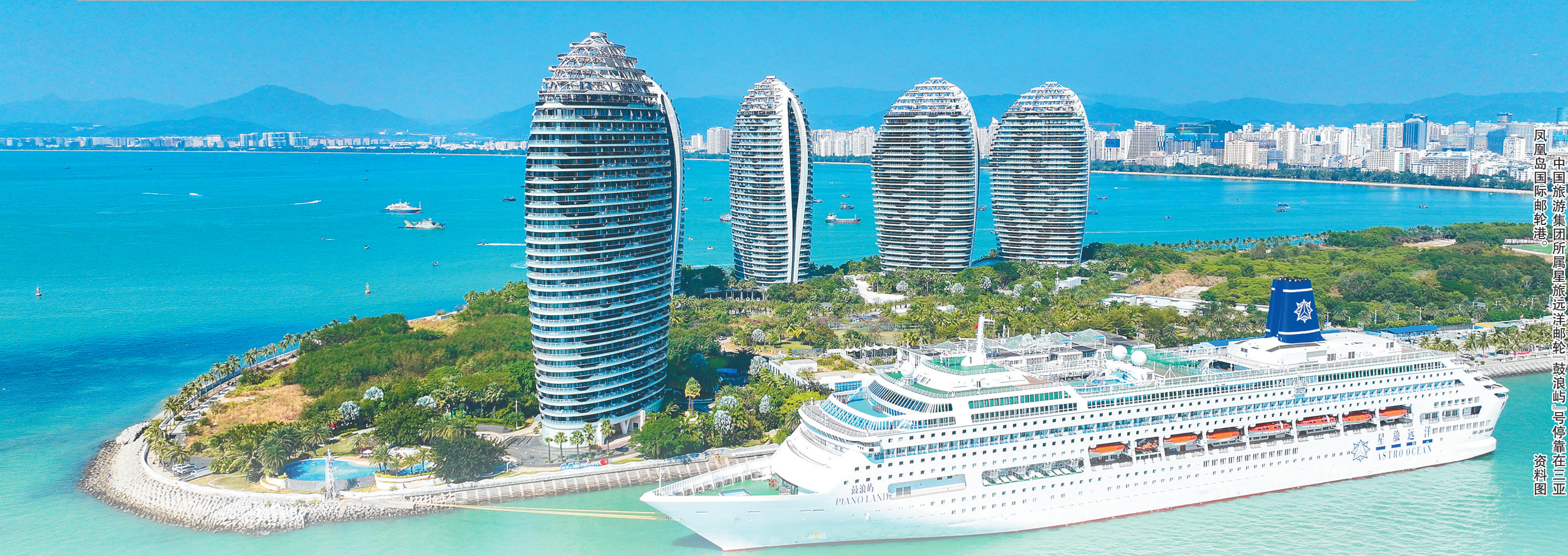
中国旅游集团所属星旅远洋邮轮“鼓浪屿”号停靠在三亚凤凰岛国际邮轮港

1月10日傍晚六点,三亚大东海沙滩上仍是一片喧闹。金发碧眼的游客们或躺卧在沙滩椅上享受落日余晖,或带着孩子在浅滩嬉水。