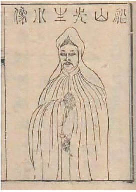
张船山画像。资料图

又将到腊八食粥时。我不禁想起清代沈复“无人与我立黄昏，无人问我粥可温”的诗句，那种孤立无援、粥食难得的情境，令人唏嘘。对此，与沈复同时代的才子、四川遂宁人张船山也深有同感。做官期间，他体谅民间疾苦，常问百姓是否有粥可温。