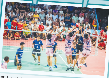
海南村VA文昌铺前站比赛现场。