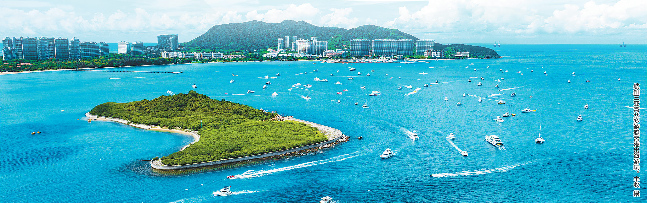
航拍三亚湾众多游艇离港出海游玩。